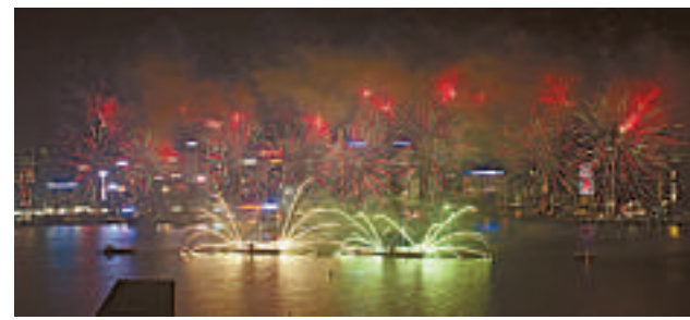
▲現場直播的「大騷」是電視最有吸引力的節目類型，例如奧運、世界杯、煙花匯演、歡樂滿東華等等