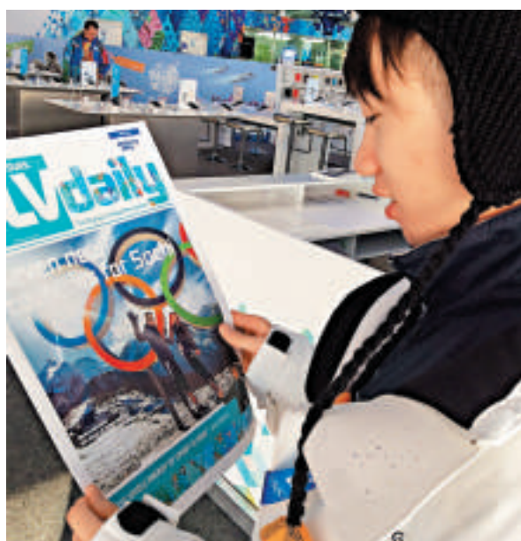
在八十年代以前，港人要知道世界及身邊的社會發生了什麼大事，主要靠報章的報道