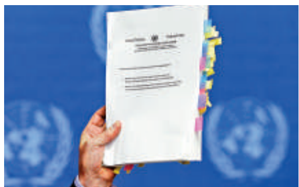
▲聯合國朝鮮人權調查委員會主席科比17日在日內瓦的記者會上，公布對朝鮮人權狀況的最終調查報告

【大公報訊】據《紐約時報》17日消息：聯合國調查人員稱朝鮮為維持其政治制度而犯下了眾多反人類罪行，並建議將朝鮮送交國際刑事法院。