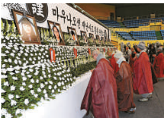
▲韓國僧人為坍塌事故的遇難者誦經

【大公報訊】據韓聯社18日消息：韓國慶州一度假村房頂坍塌事故搜救工作於18日上午11時基本結束，目前確認10人遇難，124人受傷。據中國駐釜山總領館官員18日確認，事故中沒有中國學生傷亡。韓國安全行政部長官劉正福當天上午趕赴事發現場指揮搜救工作。他向遇難者家屬表示深切慰問，並承諾將全力做好救援和善後處理工作。