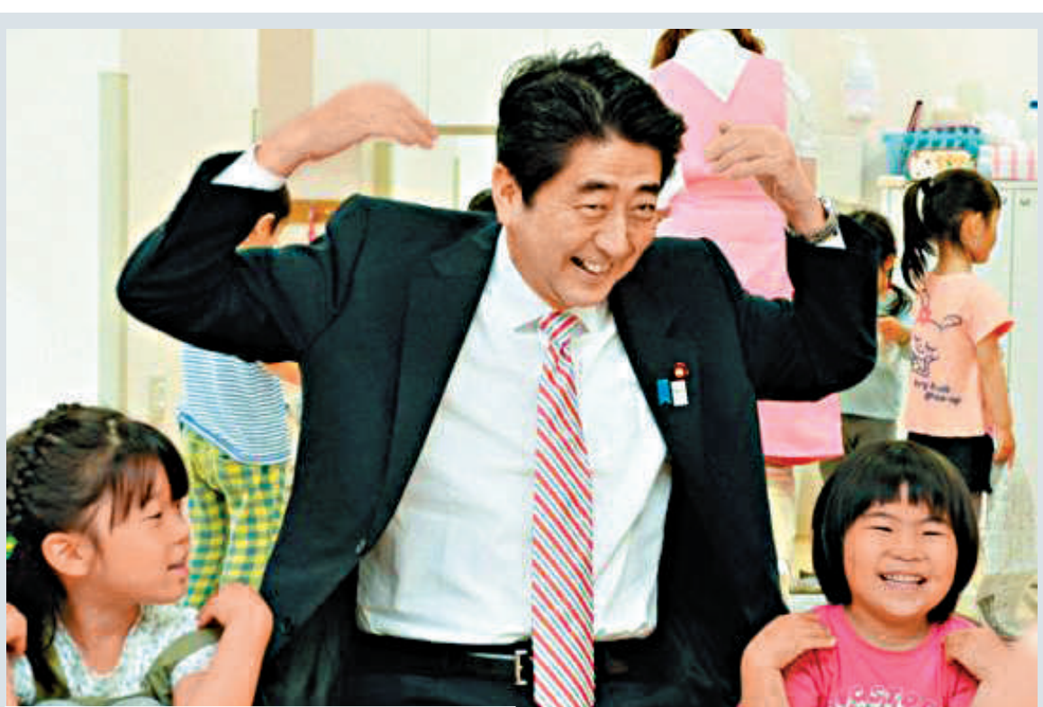
▲2013年5月21日，日本首相安倍晉三在視察橫濱託兒所時和孩子們一起玩耍 資料圖片 ▼小泉純一郎的兒子小泉進次郎 資料圖片

世襲議員即使有搞政治的父親、兄弟或前輩，他還需要當政治家秘書的經驗。政治秘書可以是受薪的國家僱員，也可以是私人使用的僱員，因此，這個行業也可以超越血緣關係，有着極大的發展空間。