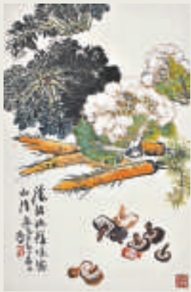
▲陸抑非畫作《鮮蔬圖》

【本報訊】記者鄧德相泉州報道：為期五天的「播芳六合——西泠印社中國書畫名家精品展」昨日在福建泉州市桑蓮居藝術館落下帷幕。作為東亞文化之都文化交流系列活動之一，本次展覽旨在促進閩浙兩地文化的交流，同時也為廣大的藝術品愛好者搭建一個藝術品收藏的平台。