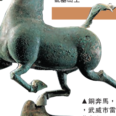
▲銅奔馬，漢代，武威市雷台漢墓出土