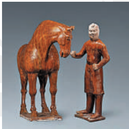
▲三彩胡人牽馬俑，唐代，秦安縣葉家堡出土