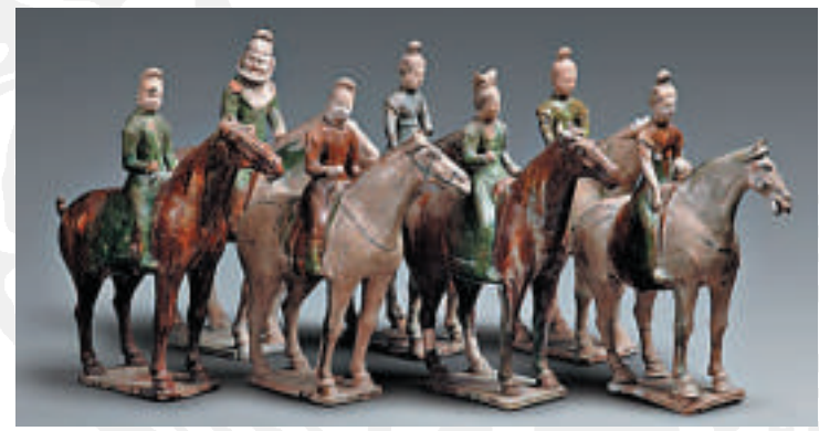
▲三彩騎俑佇列，唐代，秦安縣葉家堡出土

嘉峪關魏晉壁畫墓群中五號墓前室北壁中的「驛使圖」，則真實地反映了中國早期驛馬的形象。郵驛被歷代王朝所重視，而穿梭期間，傳達政令、遞送軍情、交流經濟的正是馬。信使左手持文書，躍馬疾馳，馬首高舉，鼻直而孔張，目大且有神，身體廓廓頸壯，圓臂細足，筋健畢露，四足騰空，精彩