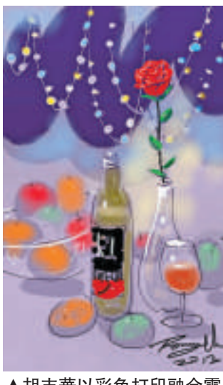
▲胡志華以彩色打印融合電子媒介作品《燈色果影》