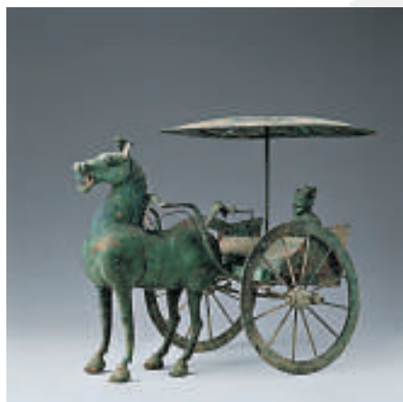
▲御駕駕馬銅轎車，漢代，武威市雷台漢墓出土