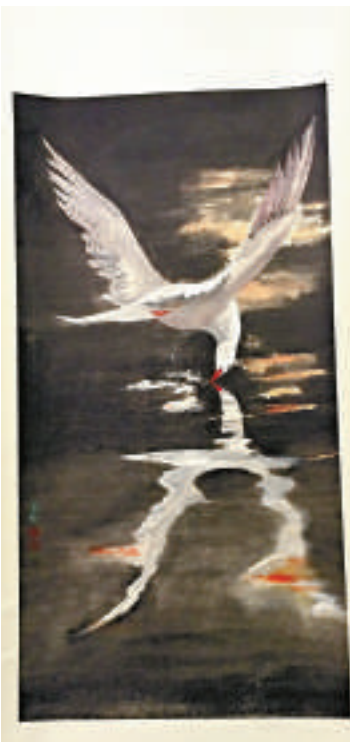
▲《太行情懷》（四屏）