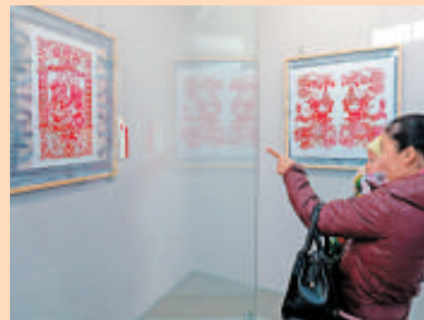
▲媽媽帶着孩子參觀窗花展

文化大省——河南是華夏歷史文明傳承創新區。為使傳統民俗文化能夠在當代社會得以傳承和延續，河南省美術館精心策劃了今次窗花藝術展。年前，河南省美術館舉辦了「過年·開封木版年畫精品展」，該展被文化部評為「全國美術館發展扶持計劃優秀展覽項目」；又於去年舉辦了「滿庭芳·新春楹聯書法展」，展出的年畫、楹聯深受觀