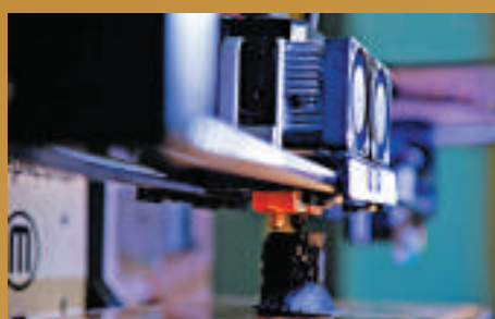
3 特殊材料打印骨盆