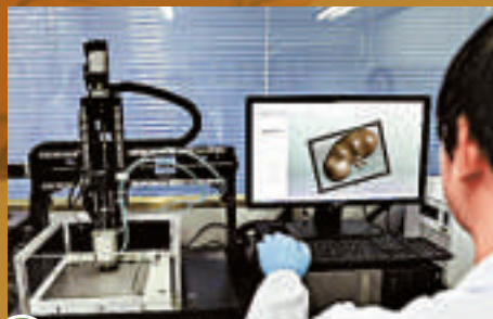
2 數據導入電腦進行三維重建及虛擬復位