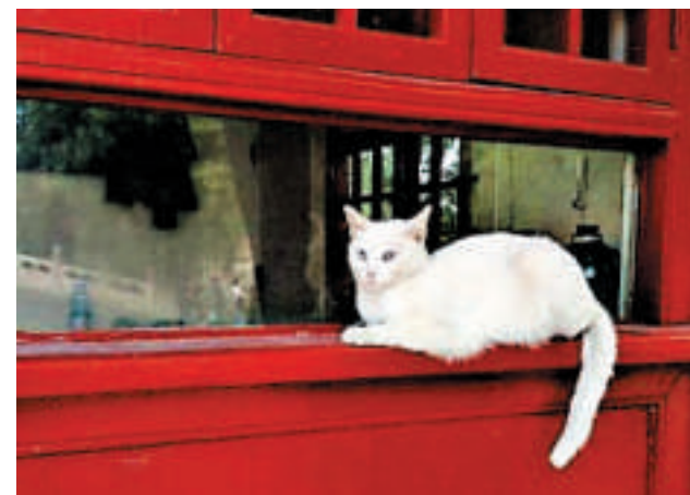
▲故宫流浪猫成防治鼠患的「保安」