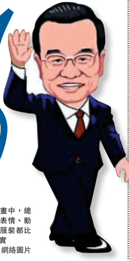
▲漫畫中，總理的表情、動作、服裝都比較寫實