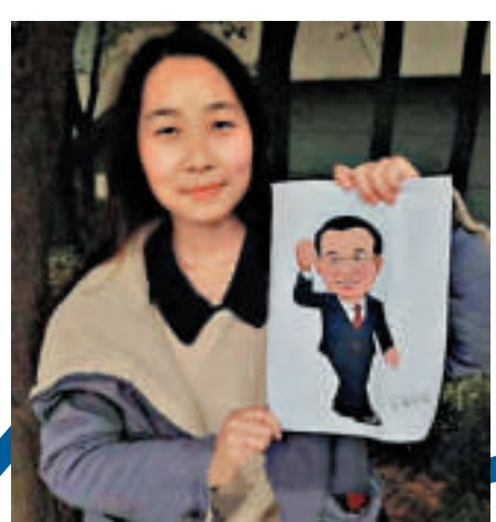
▲創作者石霽表示希望總理能看得到這幅漫畫

黃鶴松在信裡還寫了很多合肥和安徽的發展現狀。他說，希望李克強總理能夠喜歡這個漫畫，更盼望收到他的回信。（安徽商報）