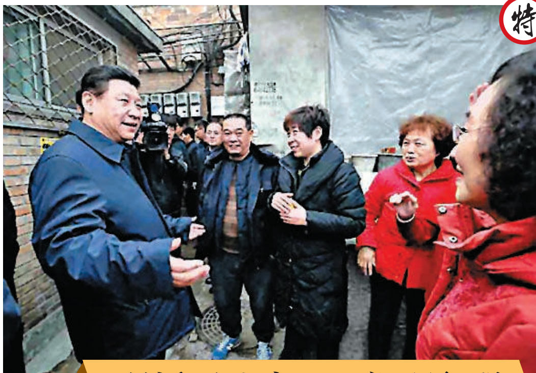
習近平北京一日調研行程

傍晚，習近平來到首都博物館參觀北京歷史文化展覽，在「燕薊神韻」、「國際都會」、「日下積勝」等展區，他在一件件寶物、一幅幅圖片前駐足，認真聽取介紹。在珍貴館藏文物展台上，習近平提醒忙著拍攝的記者們：「小心別碰到，砸了我得負責」，幽默話語引來一陣笑聲。