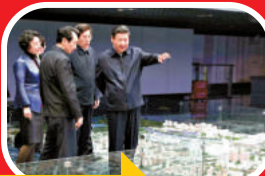
北京市規劃展覽館