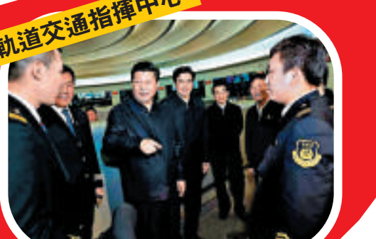
北京市軌道交通指揮中心