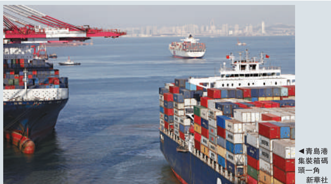
◀青島港集裝箱碼頭一角

新華網還稱，觀察數字背後的貿易結構不難發現，中國企業總體仍處於全球產業鏈中低端，普遍缺少核心技術、產品與自主品牌，產品附加值低，資源環境和人力代價大，貿易規模和盈利能力並不協調。更重要的是，高增值環節集中的服務部門發展滯後。去年中國服務貿易總額5396.4億美元，僅為美國的一半左右；作為貨物貿易順差大國，中國同時也是服務貿易逆差最大的國家。新華網稱，在由貿易大國走向貿易強國的關鍵時期，中國登上全球貿易排行榜首位，不是頂點，而是新的起點。