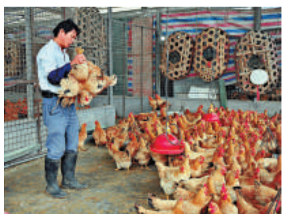
▲3月1日，廣州江村家禽批發市場裡的工作人員在檢查雞的狀況

此前，爲防控人感染H7N9禽流感疫情，廣州市決定從2月15日起全市所有禽類批發市場和農貿（肉菜）市場禽類交易區休市兩周。休市期間，全市批發市場、農貿（肉菜）市場停止一切禽類，包括活禽、光禽、冰鮮禽等交易，市場內不得存放任何禽類。