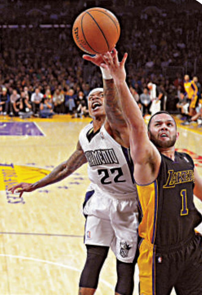
▲湖人的化馬（右）上籃，帝王的湯士（左）從後作出攔阻