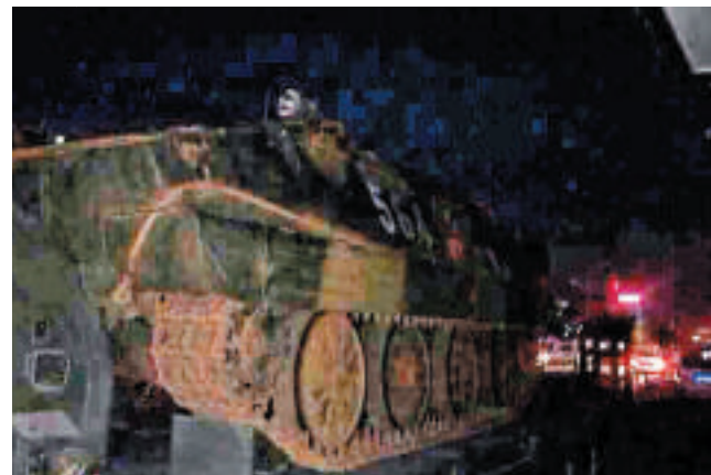
▲3日晚，位於昆明呈貢區的雲南藝術學院門口停着裝甲車 網絡圖片

中國公安部3日晚間發布，3月1日晚發生在雲南昆明火車站的嚴重暴力恐怖案告破，不少昆明市民得知案件告破後均拍手稱快，市內到處響起此起彼伏的鞭炮聲。但入夜後的昆明市並未因案件告破而放鬆，還處於全城警戒的狀態，廣州、上海和深圳等地均加強保安。