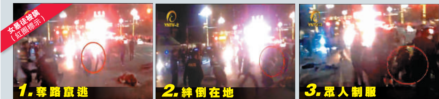
女暴徒被擒 (紅圈標示)