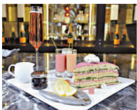
▲全球最貴的「粉紅班戟」