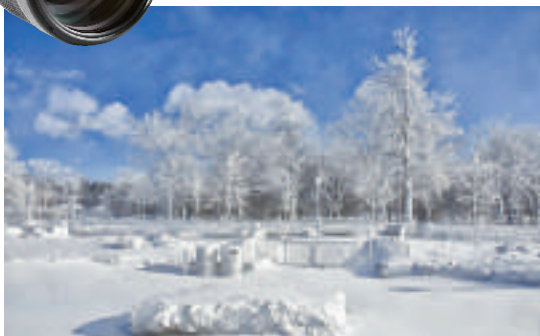
▲被白雪覆蓋的尼亞加拉大瀑布公園 ▶受極端天氣影響「速凍」稱冰雕的尼亞加拉大瀑布