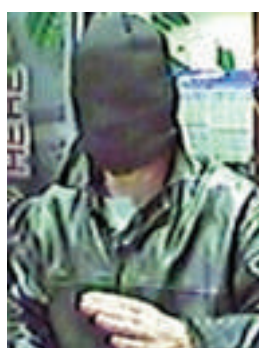
▲被攝像頭拍下的蒙面搶匪

該起案件發生在多塞特郡，上月26日晚一名蒙面賊人，闖進一間博彩公司門市，以刀威脅女收銀員，搶去大量現鈔逃去。