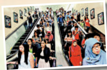
▲報告指出新加坡整體交通費用幾乎是紐約的三倍

表明歐洲物價和貨幣正在恢復升勢。報告說，歐洲城市都是躡身於休閒和娛樂類別最昂貴的城市。巴黎、奧斯陸、蘇黎世和悉尼分列2至5位。