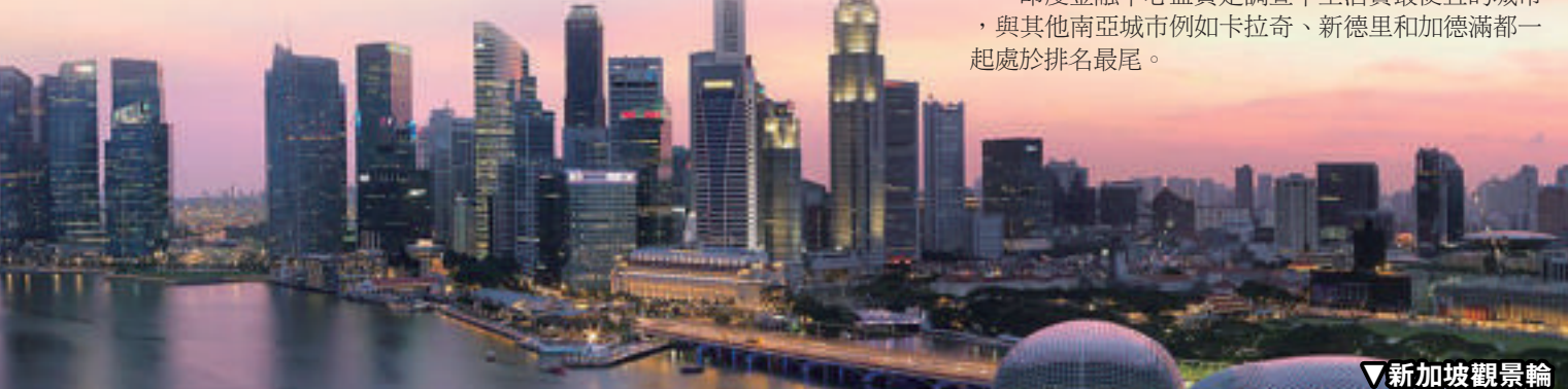
▼新加坡觀景輪