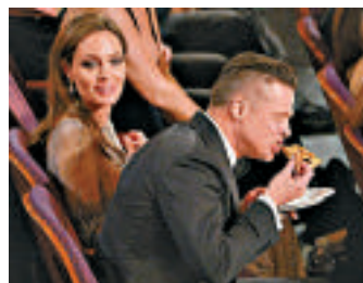
▲在奧斯卡頒獎禮上大嚼披薩的畢彼得 ▶披薩小伙艾德格和愛倫狄珍妮絲 英國《每日郵報》

「粉紅班戟」出現前的最貴班戟也出自同一間餐廳。該餐廳2009年時，製作了一款由每類3英鎊的馬達加斯加雲呢嚨籽和每張8英鎊的23卡可吃金箔製成，以有機士多啤梨及以每瓶115英鎊的唐培里農香檳釀成的嗜睡伴吃的班戟。