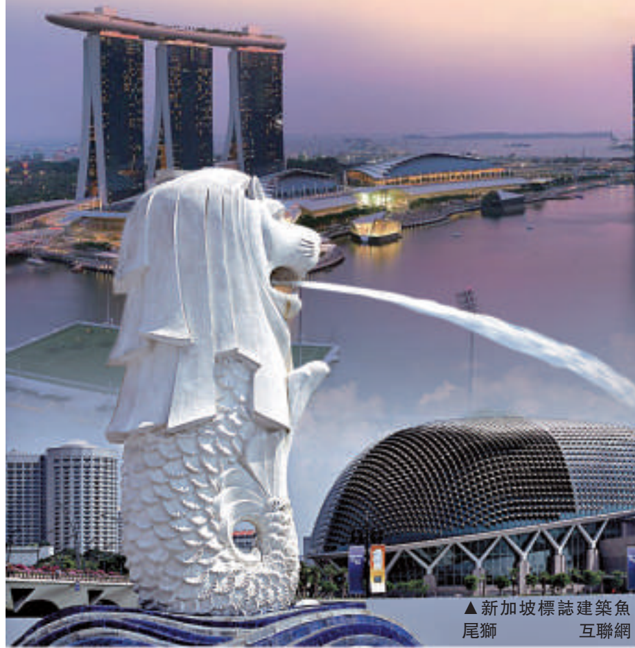
▲新加坡標誌建築魚尾獅 互聯網

印度金融中心孟買是調查中生活費最便宜的城市，與其他南亞城市例如卡拉奇、新德里和加德滿都一起處於排名最尾。