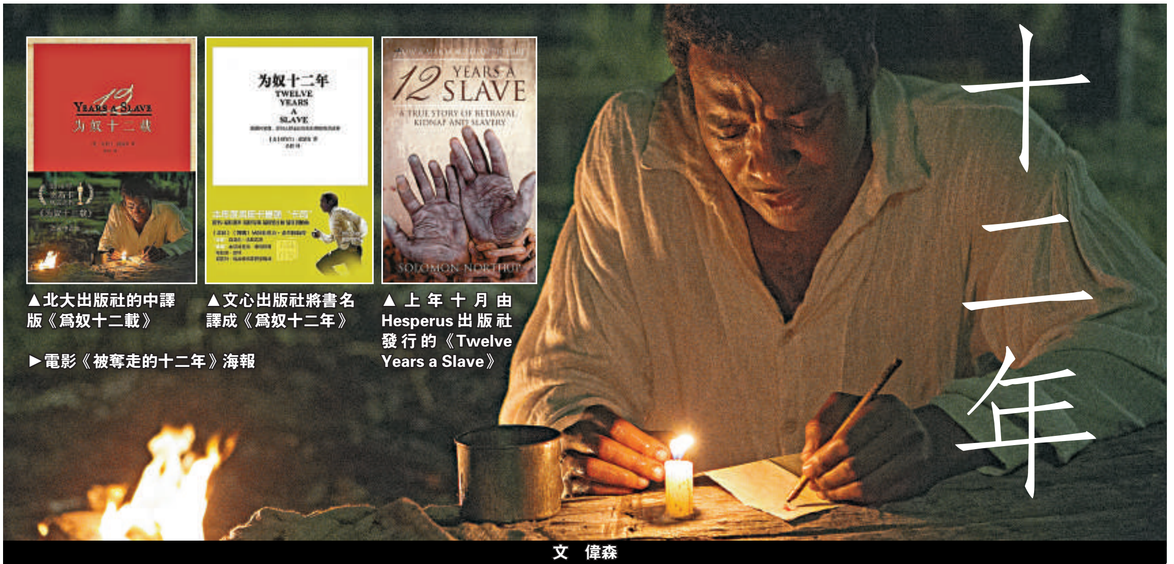
▲北大出版社的中譯版《為奴十二載》