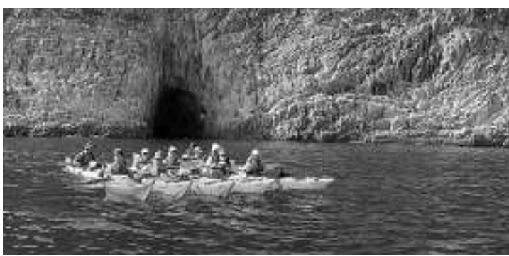
▲同學於旅程中，划着獨木舟穿梭西貢海域不同的海灣

除此之外，學校今年更獲得非牟利志願組織「成就一生網絡」提供一個為期三年的「師友計劃」服務。而這個計劃，該校是全港唯一獲得此服務的學校。在未來三年，百多位社會成功人士，包括會計師、心理學家、社工、商人及退休人士等擔任義務導師，以一對一的支援方式，陪伴中四同學成長，直至完成中學文憑考試。義工們會與學生分享自身的經驗和知識，並透過遊戲和小組討論，教導學生應以負責任的態度去確立人生目標，做一個「對社會有貢獻」的人。