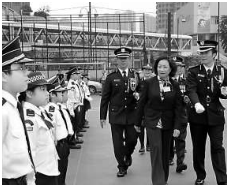
▲行政長官夫人梁唐青儀（右二）檢閱升旗隊

許曉暉在典禮上致辭時表示，豬大使擔當重要角色，向同學灌輸儲蓄習慣，從小習慣關懷別人，令活動圓滿成功。