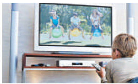
▲兩眼盯着電視，收看節目一個接着一個，電視觀眾仿如「傻仔」

免費電視主要收入來源是廣告，而廣告費跟收視率掛鉤，收視率越高，廣告收入便越多，當然要出盡辦法令觀眾睇電視睇上癮，最好一天十多小時開着電視，並