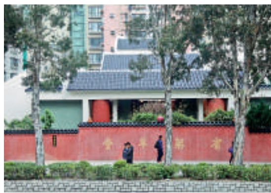
省躬草堂是大埔區最悠久的道堂

近日多次帶領有興趣地區歷史的人參觀大埔新舊兩墟，所到之處包括圍園、太和市、廣福橋和舊墟天后宮。當抵達天后宮之前，會經過一列長長的紅牆，壁上書寫「省躬草堂」四字，那是道家清修之地。以往我帶團都是過其門而不入，以免造成打擾。最近一次因參加者不多，臨時決定入內參觀，剛好碰上多年前認識的道長。在他帶領下走進堂內各處，對這座看似封閉的地方有更深入的了解。省躬草堂於一八九四年在廣州設立，供弟子們反躬自省，同時向民衆贈醫施藥。一九二六年弟子獲道神仙廣成子指示來港建堂，其後購買大埔汀角路一幅臨海之地建成草堂，共有三進結構。前方築有一幅紅色圍牆，作用如同照壁，阻擋迎面而來的海水和不祥的煞氣。一九九〇年重建，同樣有三進，雖然現今已遠離海邊，但依舊興建圍牆「保護」。堂內打掃得一塵不染，殿內的香爐只燃點香木，沒有香燭。第二進的主殿供奉廣成子，還有鎮壇神和祿神。省躬草堂過去以扶乩問事，他們認為祿神附在乩筆可向神仙傳遞信息。隨著有經驗的乩手一一去世，扶乩活動已停止了。草堂於一九九一年在毗鄰開設中、西醫診所，提供廉價醫療，並預留免費名額給社區機構轉介的病人。從立堂至今，弟子們依循乩示，不收外界分文，靠草堂昔日所建的物業收租，維持善舉。