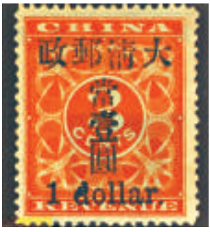
附圖為其中一枚大小字體（下方英文小楷「d」字）雙重加蓋的錯體票，僅存一枚；乃最後發現的第三十二枚「紅印花小壹圓」存世票，一直以來被藏於一名已故外國集郵家銀行地窖保險箱裡，不為人所知。

最早加蓋「當壹圓」者，原屬小字；但負責人覺得字體過小，要把鉛字全換成大字「當壹圓」。小字「當壹圓」只加蓋了四十枚；現知僅存三十二枚，餘八枚下落不明，恐已被毀；其中四方連者為孤品，橫雙連者亦獨一無二，蔚成國郵之寶。四枚單票為異體，但錯漏各不同，俱屬孤品。逾半數已散失或被毀。原票四方連乃孤品。最近加蓋「當壹圓」者，原屬小字；但負責人覺得字體過小，要把鉛字全換成大字「當壹圓」。小字「當壹圓」只加蓋了四十枚；現知僅存三十二枚，餘八枚下落不明，恐已被毀；其中四方連者為孤品，橫雙連者亦獨一無二，蔚成國郵之寶。四枚單票為異體，但錯漏各不同，俱屬孤品。逾半數已散失或被毀。原票四方連乃孤品。