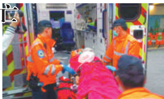
▲男傷者送院搶救後不治

昨日下午5時許，上址街坊突聞一聲巨響，探頭窗外查看，赫然一對男女倒臥在3樓窗簾，全身浴血，奄奄一息，大驚下馬上代為報警求救。消防員及救護員到場，證實女死者已當場死亡，男事主則仍有呼吸，遂將他送往伊利沙伯醫院，惜經搶救後證實不治，而女死者遺體則由消防員抬到3樓走廊等候檢驗。大批警員趕至增援，封鎖現場進行調查，並透過升降機閉路電視錄影片段，得悉兩人乘升降機到18樓，相信雙雙攀越走廊欄杆墮下，事件初步相信無可疑。警方於事發後在現場帶走男死者2女1男親友，到醫院認