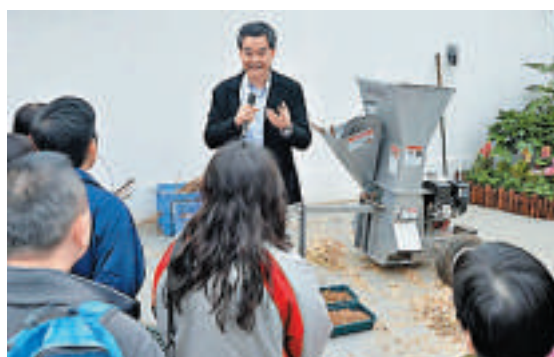
▲行政長官梁振英向參加「預展」的市民介紹禮賓府的碎樹枝機

政府發言人表示，今日將會安排香港警察樂隊及學生樂團在花園表演，供市民一邊遊覽、一邊欣賞音樂。市民除可進入禮賓府花園觀賞花卉樹木外，還可以參觀行政長官在禮賓府舉行官方活動和接待賓客的地方。遊覽路線沿途放置二維條碼及展板，市民可以流動裝置配合相關軟件，瀏覽禮賓府及花卉資料，現場亦會有導賞員介紹禮賓府的歷史及建築特色。