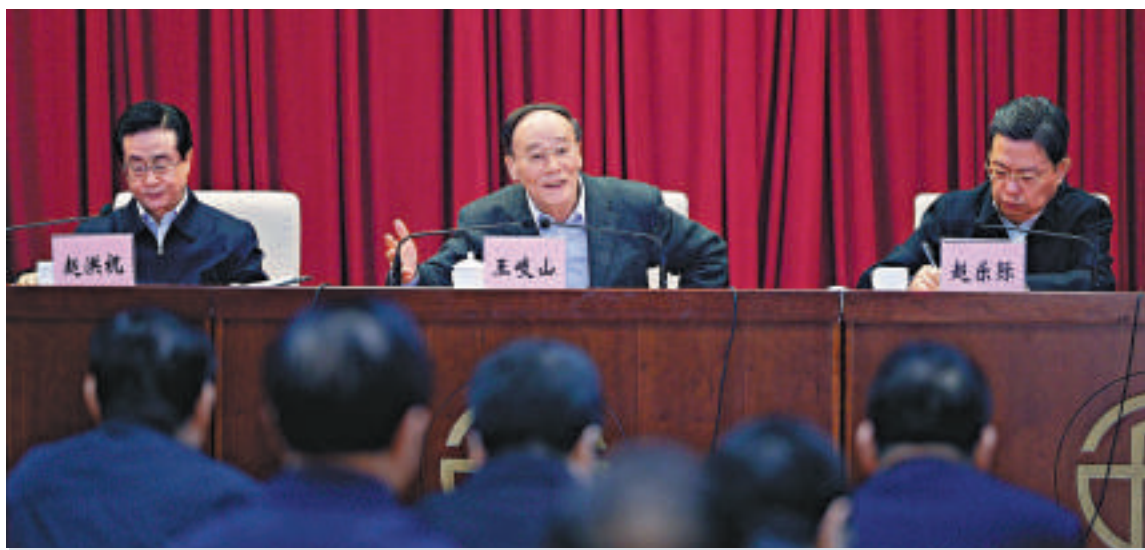
▲3月15日，中共中央政治局常委、中央紀委書記、中央巡視工作領導小組組長王岐山出席中央巡視工作動員部署會議並講話

會議提出，廣東要繼續把推動產業轉型升級作為經濟工作的重要任務抓好抓實，努力推動產業向價值鏈的高端發展。