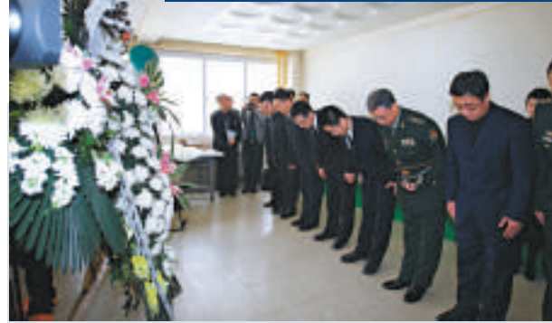
3月17日，中韓雙方在韓國京畿道坡州市啓動實施在韓中國人民志願軍烈士遺骸裝殮工作。中方代表在現場舉行悼念活動。此次裝殮的遺骸共有437具，約需十餘日。