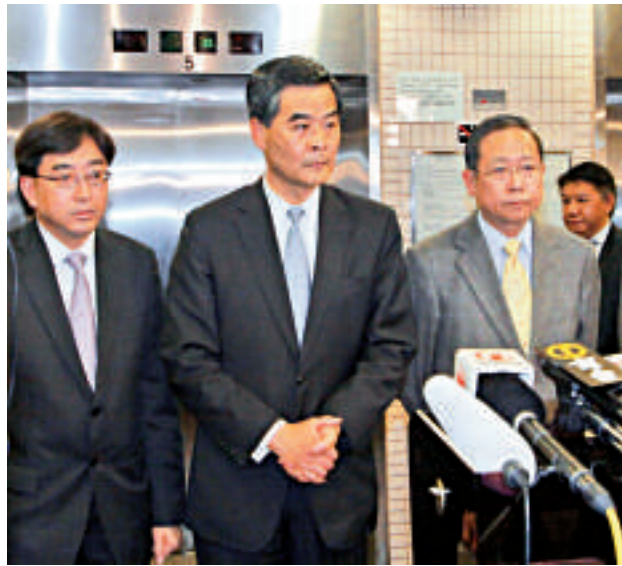
▲特首梁振英對事件極表關注，曾到醫院探望劉進圖

3月13日警方再拘捕1男1女疑犯。3月17日內地公安將東莞落網的2名疑犯轉交香港警方。