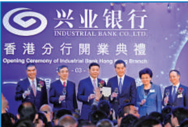
▲左起：興業銀行香港分行行長胡麟、署理理財事務及庫務局局長劉怡翔、興業銀行董事長高建平、香港特別行政區行政長官梁振英、中聯辦副主任殷曉靜及興業銀行行長李仁傑