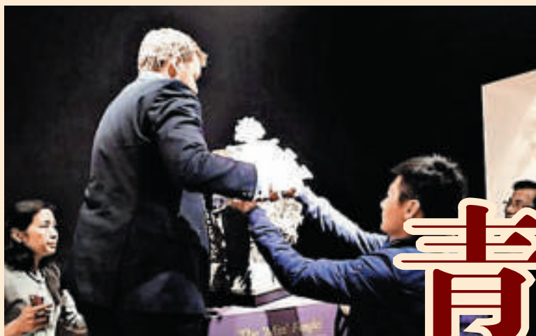
▲3D打印的「皿天全」盞蓋模型與皿方罍器身進行對比

曾創下世界拍賣市場最高成交紀錄的中國青銅器皿方罍（音同雷Lei）將回歸中國。世界著名拍賣行佳士得19日在紐約宣布，在佳士得的協助下，來自中國湖南的收藏家群體當日已經與皿方罍當前所有者達成買賣協議。據知，這件世界罕見青銅器「方罍之王」將捐贈給湖南省博物館。