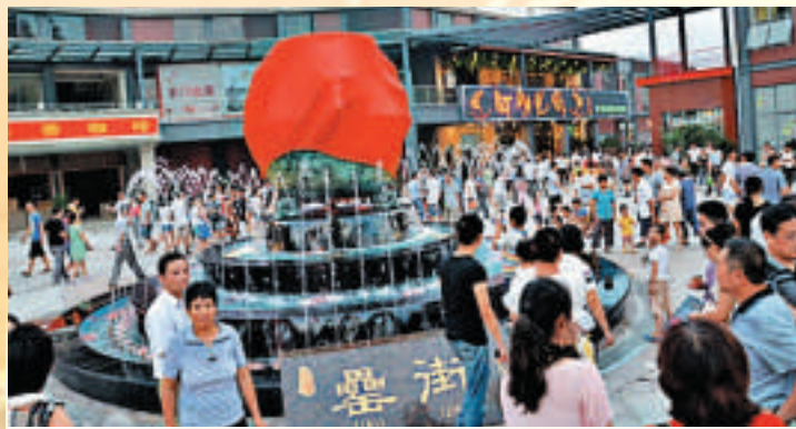
◀合肥市街用青銅製作了一個「罍」雕塑，作為鎮街之寶