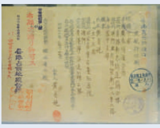
◀香港日佔時期的出入境許可證