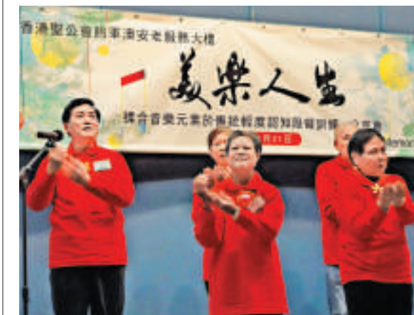
▲香港聖公會福利協會首創將音樂元素融入傳統訓練，治療患有「輕度認知障礙」的長者

【大公報訊】記者彩雲報道：全港目前至少有60000長者患有「輕度認知障礙」，其中每年有10%至20%最終會患上腦退化症。香港聖公會福利協會首創將音樂元素融入傳統訓練，治療患有「輕度認知障礙」的長者。香港教育學院心理研究助理教授黃沛霖表