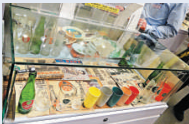
▲曾風靡數十載的綠寶橙汁