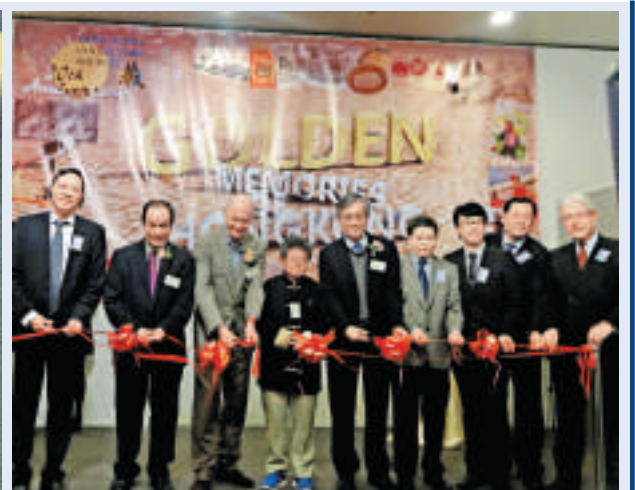
▲嘉賓賓於昨日開幕禮上剪綵

曾經風靡數十年的綠寶橙汁，早已不復存在。但昔日「綠寶」，仍可在展場尋到它的「身影」，一排排飲料瓶，一張張廣告單。承載香港集體回憶的「綠寶」，不僅僅是一種回憶的標識，更可從中，看到當時綠寶橙汁與當時香港歲月聯繫的那