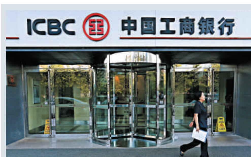
◀據悉,自中誠信託違約危機的風波後,工商銀行已不再代銷信託代銷

根據《信託公司集合資金信託計劃管理辦法》,信託公司在推介信託計劃時,不得進行公開營銷