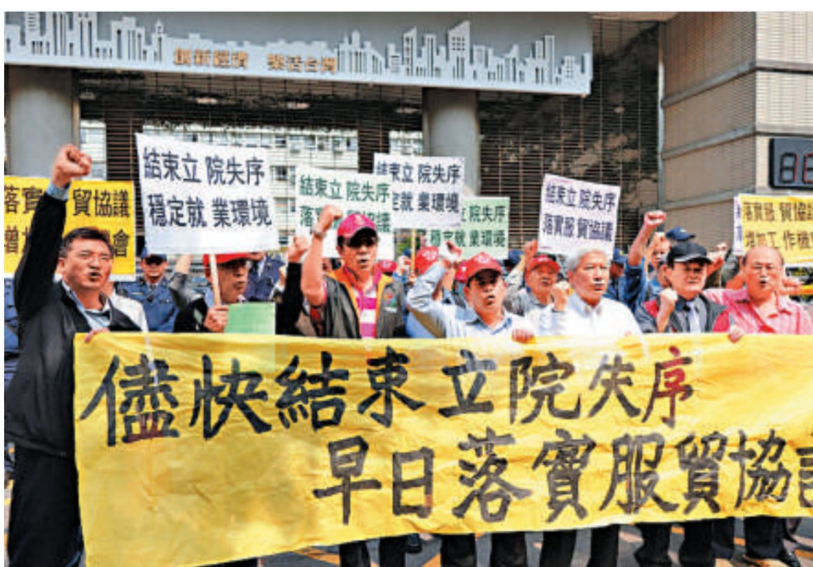
▲島內支持服貿的團體日前舉行集會，呼籲兩岸服貿協議儘快生效