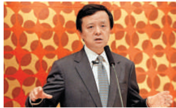
▲港交所行政總裁李小加

評級機構穆迪把中信集團、中信泰富及中信資源(01205)評級，列入上調複評名單內。該行副總裁兼高級分析師周莫深(Joe Morrison)解釋，這反映該行預計交易將顯著擴大中信泰富的規模，又視今次交易是中信集團整體上市的一步。