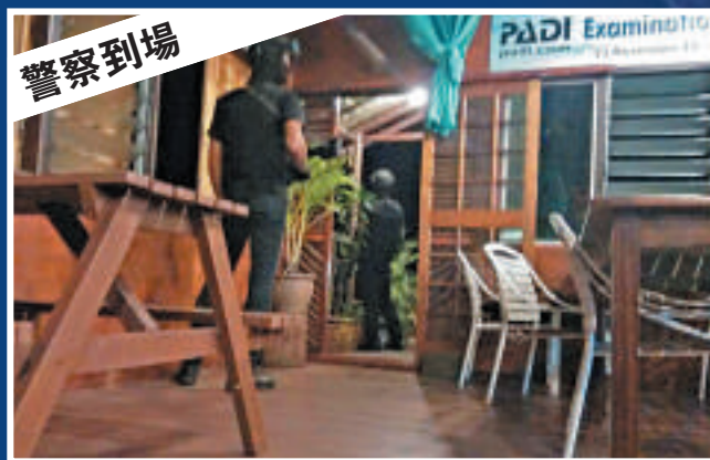
▲當地警察事發後在酒店警戒