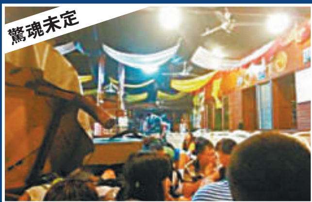
▲驚魂未定的遊客聚集在酒店內