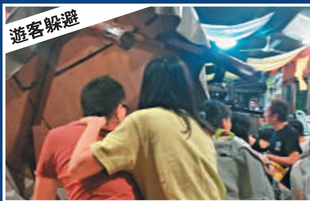
▲聽見槍聲，現場所有人立即趴下躲避