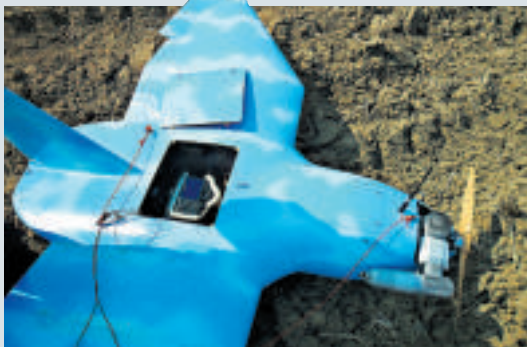
▲上月24日在坡州墜毀的朝鮮小型無人偵察機