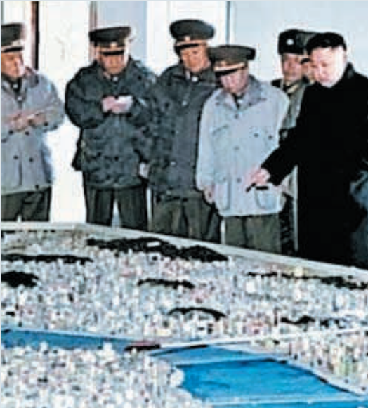
▲2013年3月23日訪問對韓特殊戰鬥部隊1973部隊的金正恩（右）在首爾市內模型前指着青瓦台方向