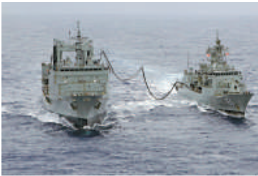
▲澳方繼續海上搜救工作