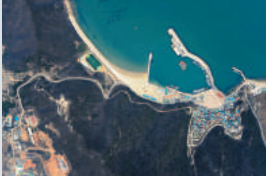
▲朝鮮無人機拍下的韓國大青島鳥瞰照