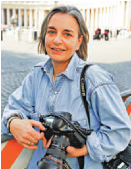
▲美聯社記者尼德林豪斯2005年4月在羅馬