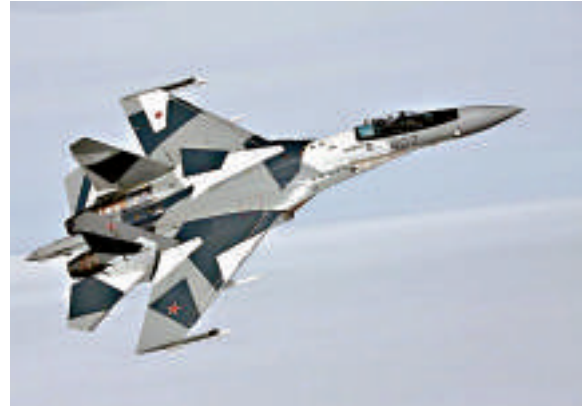
▲中俄2013年簽署了引進「蘇-35」戰機的協議

未來20年戰略核威懾的中堅力量；航天裝備方面，北斗導航系統將提供重要服務，配合太空裝備和反導系統的研製。文章指出，中國除了自主研發武器裝備外，還要外購武器裝備，主要是俄羅斯的武器裝備。文章提到中俄2013年已簽署了引進「蘇-35」戰機的協議，俄國還同中國簽訂了為中國海軍設計並建造4艘「阿穆爾」級潛艇的框架合同，這筆總額接近20億美元的大單有望在2015年左右最後敲定。如果普京批准對華出售S400系統落實，這意味着中俄在防空防導領域方面的軍事合作更加緊密，對中國在東海、南海的戰略部署意味深長。