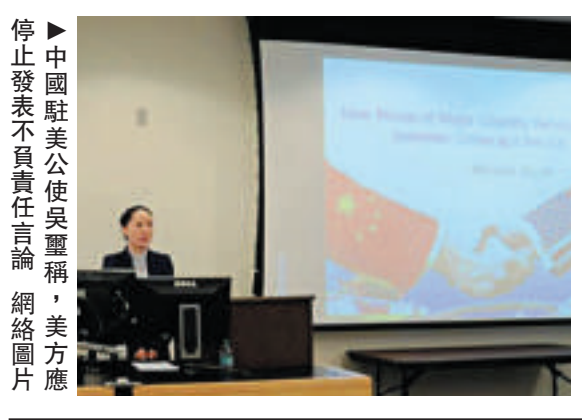
▶中國駐美公使吳驥稱，美方應停止發表不負責任言論

，領土主權爭議應由直接有關的主權國家通過友好磋商和談判，以和平方式解決。應停止發表不負責任言論。吳驥強調，如果美方真心維護地區和平與穩定，就應真誠履行在領土主權問題上不持立場的承諾，尤其是應停止發表不負責任的言論，停止任何可能助長某些國家挑釁和冒險的言行。另一方面，吳驥表示，去年6月，中美元首在加州安納伯格莊園就中美構建新型大國關係達成共識，為兩國關係未來發展指明了方向。一年來，中美關係取得長足進展。把不衝突、不對抗、相互尊重、合作共贏的中美新型大國關係變成現實，需要雙方共同努力。她呼籲今後中美應繼續保持密切高層交往，擴大經貿投資合作，增加兩軍交流對話，實現在亞太地區的良好互動，加強在國際地區問題上的協調合作。