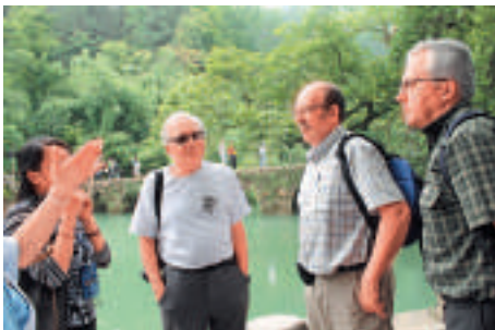
▲荔波——世界遺產地吸引大量的外國遊客

據數據顯示，2013年貴州省主要監測城市中貴陽市按照國家環境空氣質量新標準，全年空氣質量優良天數278天，優良率76.2%，在全國執行新標準的74個重點城市空氣質量排名中居第10位，省會城市中排名第4位。遵義、六盤水、安順、凱里、都勻、興義、畢節、赤水、仁懷、福泉10個城市達到國家環境空氣質量二級標準。