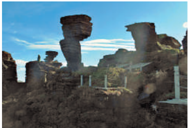
▲貴州名勝景區——梵淨山 資料圖片