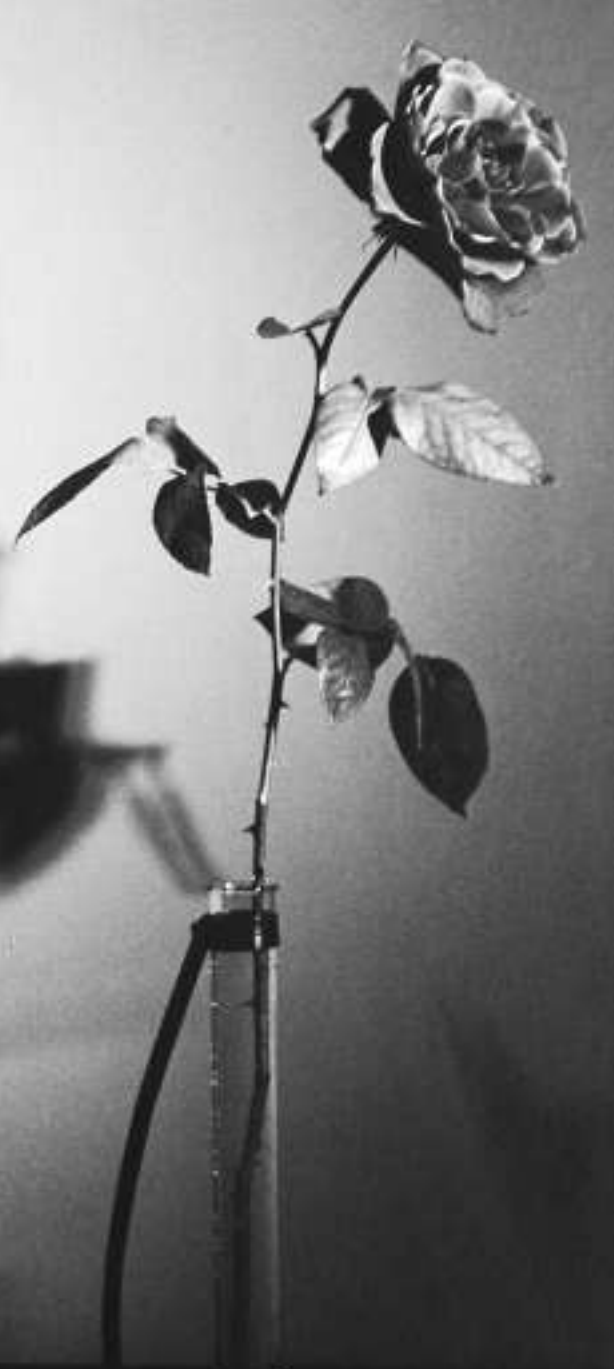
▲羅伯特·梅普爾索普：《玫瑰 紐約》，明膠銀鹽照片，一九七七年