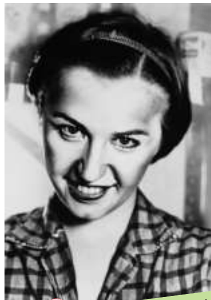
▲辛迪·舍曼：《無題（鄉村姑娘）》，明膠銀鹽照片，一九七五年