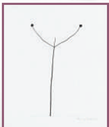
▲哈里·卡拉漢：《天空下的野草》，明膠銀鹽照片，一九四八年