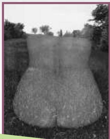
▲哈里·卡拉漢：《埃莉諾，普羅旺斯的艾斯城》，明膠銀鹽照片，一九五八年