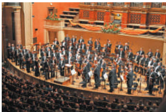
▲捷克愛樂樂團將為香港樂迷帶來兩場音樂會

捷克愛樂樂團音樂會將於六月三日及四日（星期二及三）晚上八時於香港文化中心音樂廳舉行。門票在各城市電腦售票處發售。該節目設兩場音樂會前導賞講座，免費入場，座位有限，先到先得。詳情如下：六月三日（星期二）晚上六時四十五分，香港文化