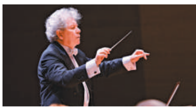
▲捷克愛樂樂團首席指揮貝洛維克