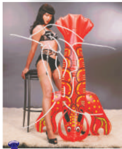
▲傑夫·昆斯：《無題》，數字打印照片，二〇〇九年