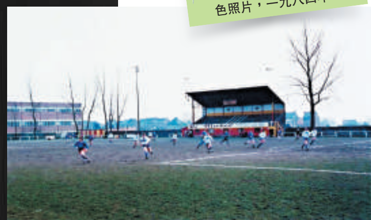
▲安德烈亞斯·古爾斯基：《無題》，C-print彩色照片，一九八四年