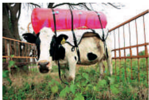
▲美國「未來之牛」身背沼氣收集瓶

據報道，來自化石燃料的二氧化碳是主要的人造溫室氣體，不過甲烷的溫室效應要顯著得多。美國8800萬頭牛產生的甲烷比垃圾埋