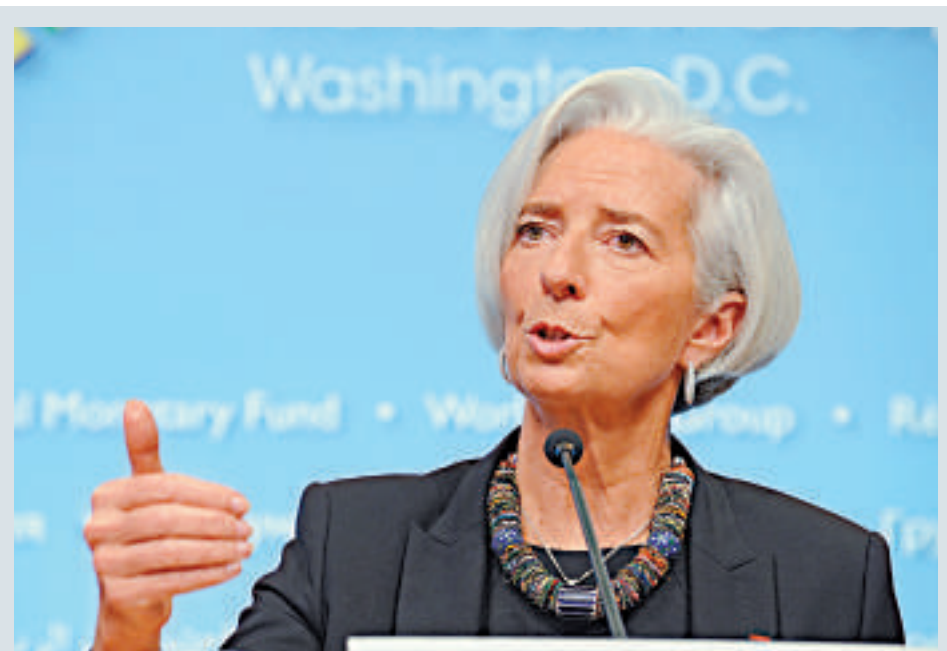
▲國際貨幣基金總裁拉加德稱，會繼續向美國施壓使改革方案實現

認繳份額是IMF資金的主要來源。IMF的每個成員國都會基於該成員國在世界經濟中的相對地位被分配一定的份額。份額多少決定了在IMF決策時的投票權比重和可以獲得的IMF貸款多少。