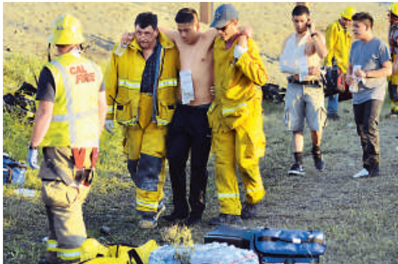
▲加州5號州際公路車禍現場

據報道，10名死者中包括了5名高中生、3名隨從人員以及聯邦快遞貨車司機及遊覽車司機。加州公路警察稱，遊覽車上載有46名來自洛杉磯的高中生，原本計劃到加州州立大學洪堡分校參訪。