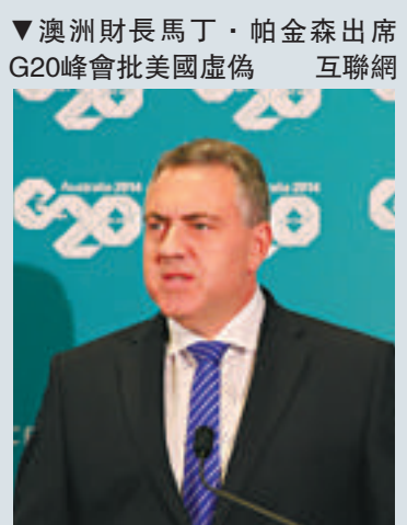
▲澳洲財長馬丁·帕金森出席G20峰會批美國虛偽 互聯網