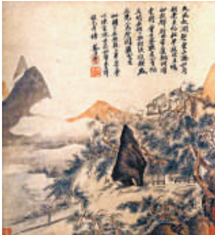
▲吳歷設色潤壑松聲