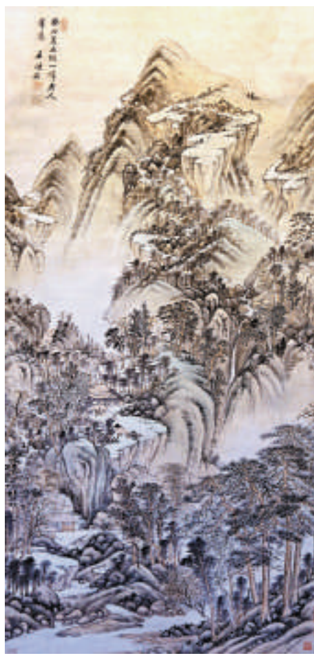
▲王時敏設色仿古山水