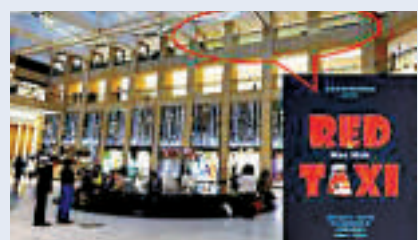
◀置地廣場中庭三樓展出「Red Taxi」畫作