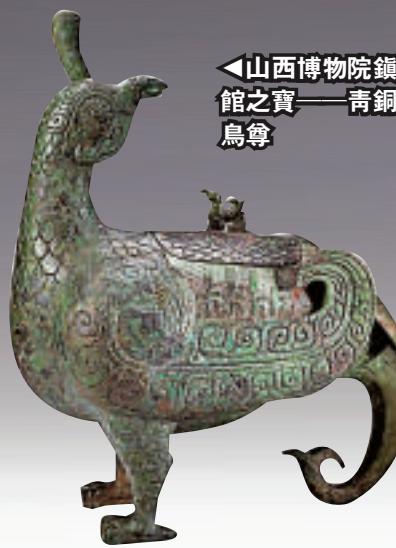
◀山西博物院鎮館之寶——青銅鳥尊