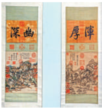
▲王原祁設色山水圖二條屏