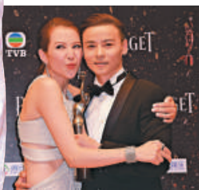
張晉（右）奪最佳男配角，太太蔡少芬激動落淚