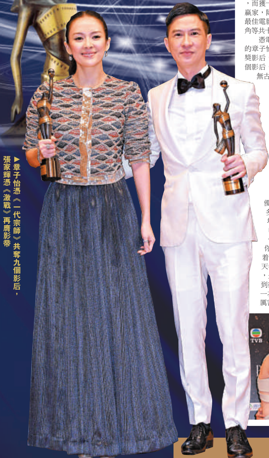
張家輝憑《激戰》再膺影帝，章子怡憑《一代宗師》共奪九個影后。

其後張晉與Ada一起到記者室接受訪問，Ada表示很替老公開心，當頒獎時她內心不斷輕聲叫「張晉張晉」，但當梁洛施宣布張晉得獎時，她竟不懂反應，她表示真的很替老公開心。而張晉坦言會偷偷想過得獎，但當真的得獎時真的很緊張，連手也不知道該放在哪裡。此外，張家輝及Baby奪最佳衣着獎，家輝獲得一對白金袖口鈕，Baby則獲得玫瑰金鑲鑽垂飾。Baby就直言男主角獎項一定是他拿的，又謂想不到今次出席會有少少榮幸，所以覺得好開心，更形容今次與家輝是「父女檔」拿獎，因最近他們正合作一部新戲並飾演父女。