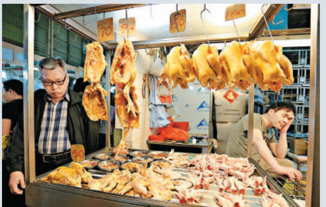
▲李先生(右)說，市民以為全港雞販停市，令街市人流大減