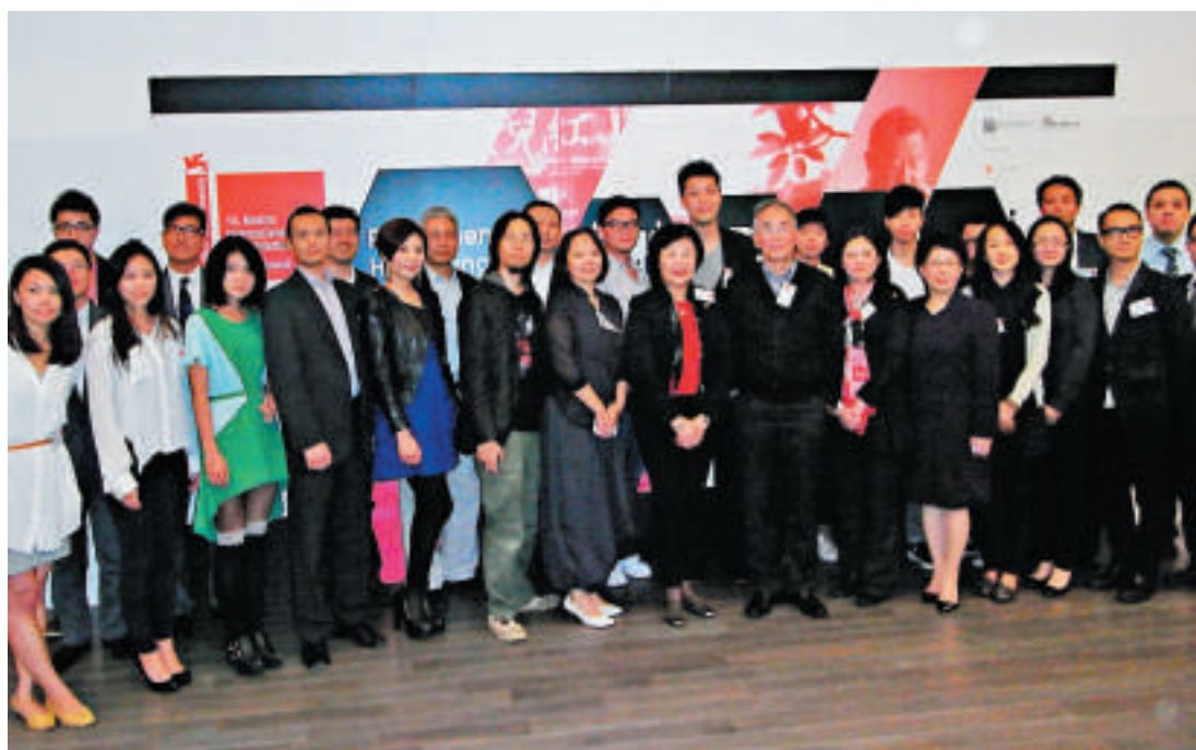
▲三位策展人、四位短片導演、主辦單位代表及一眾嘉賓合照

有關雙年展之香港展覽的詳情，將會由四月二十二日起於官方網站： www.venicebiennale.hk/2014 ，以及Facebook專頁： www.facebook.com/thehka發布 。