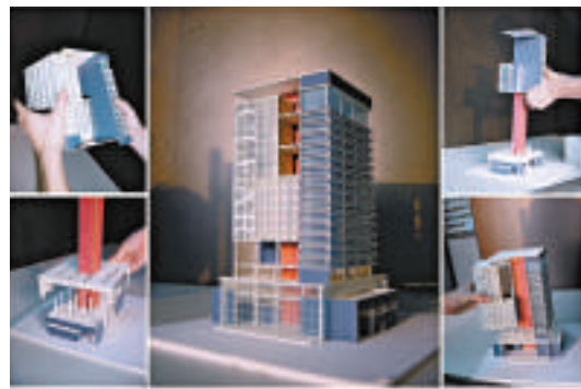
▲其中一個參展的建築模型