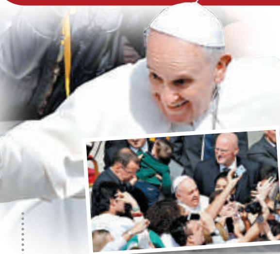
教皇方濟各13日彌撒後與群眾互動

班克斯是一位匿名的英國塗鴉藝術家，被稱為「塗鴉教父」他的作品不僅限於英國，其作品時常在世界各地不同城市的街道中出現，甚至會成為當地引人入勝的旅遊景點。