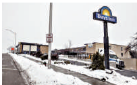
威斯康星國際學校買下的Days Inn酒店 互聯網

目前，有90名威斯康星國際學院就讀的中國留學生租住在另外一家戴斯酒店內。該學院預計2014-2015學年將有150名中國留學生。此外，這家改造後的宿舍將接待20至30人的夏令營。