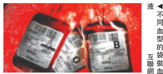
不同血型的袋裝血液

香港政府已於十幾年前就將「地貧」宣傳開展到各間中學，地中海貧血的發病率、攜帶率及發病成因，香港中學生都了解得清清楚楚。這樣，接受了地貧知識普及的孩子長大後，結婚生子時注意對地貧基因的檢測，從而使近年本港「地貧」患者出生率大大降低。