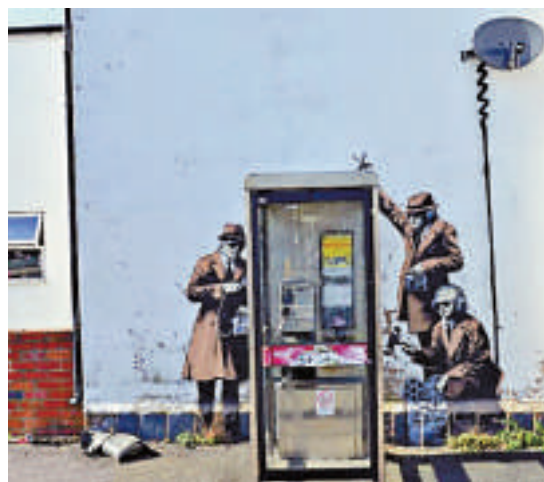
疑為班克斯新作的諷刺塗鴉

【大公報訊】據英國《每日郵報》14日消息：當地時間13日清晨，英國城市切爾滕納姆的一座房屋外的牆上，出現了疑似英國著名塗鴉藝術家班克斯（Banksy）的作品。作品中，3位身穿風衣的探員在對一個公共電話亭進行監聽。