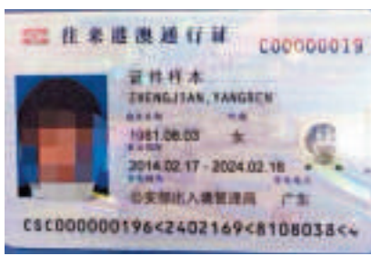
▲從樣本可見，港澳「通行卡」與「回鄉卡」或內地居民身份證大小一樣