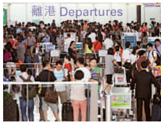
▲入境處預計，復活節假期期間約有495萬旅客人次經各管制站進出本港

員支援各管制站的工作，並已減少前線人員休假期，以便彈性調配人手，亦會加開檢查櫃位。處方亦呼籲旅客預早計劃行程並盡量避免選擇在一些繁忙時段過關，並留意各邊境管制站有關交通情況的電台、電視廣播。