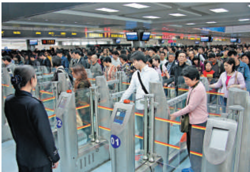
▲港澳「通行卡」將以廣東為試點，其中深圳口岸將率先試行憑「通行卡」全自助通關，最快僅需四至五秒鐘

不過，短期內廣州火車站、白雲機場等其他邊檢口岸暫不會試行「通行卡」自助通關。消息人士解釋說，因為其他口岸的自助設備還要待跟進建設，但比起現在較複雜的通關查驗流程也要簡化得多，不僅省去錄入簿式通行證姓名資料等手續，而且免去蓋章環節，只需由邊檢警察刷卡便能放行，較目前的驗放過程大致可省時一半。