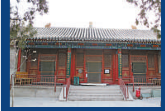
▲村裡穆斯林民眾現在仍在這裡禮拜