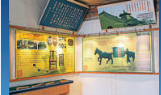
▲清真寺裡展出的史實資料