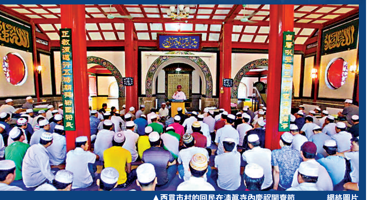
▲西貫市村的回民在清真寺內慶祝開齋節