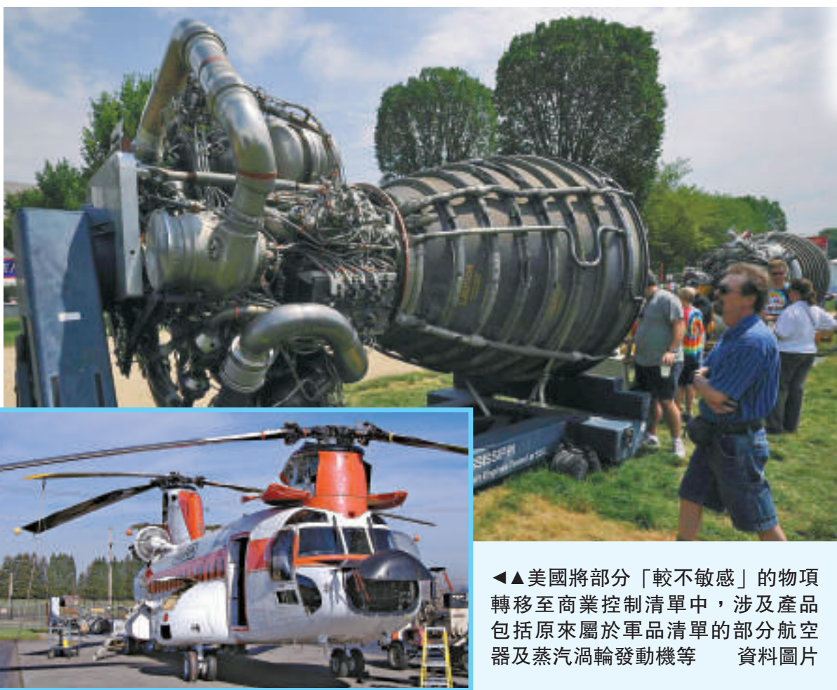
▲美國將部分「較不敏感」的物項轉移至商業控制清單中，涉及產品包括原來屬於軍品清單的部分航空器及蒸汽渦輪發動機等。資料圖片

【大公報訊】美國開始放鬆對華衛星、軍品的出口管制。據商務部發表的報告顯示，美國已經將部分「較不敏感」的物項轉移至商業控制清單中，涉及產品包括原來屬於軍品清單的部分航空器、蒸汽渦輪發動機、水面艦及潛水艇等。 據21世紀網報道，商務部17日發布《國別貿易投資環境報告2014》，介紹了美國、歐盟、日本、巴西、俄羅斯等中國13個主要貿易夥伴的貿易投資管理體制及措施的變化情況，分析其可能對外貿投資產生的壁壘，評估貿易環境等。 值得注意的是，美國對部分軍事物品出口的管制開始放鬆，而不是像過去一樣，把所有可能與國防有關的商品統統限制在國內。