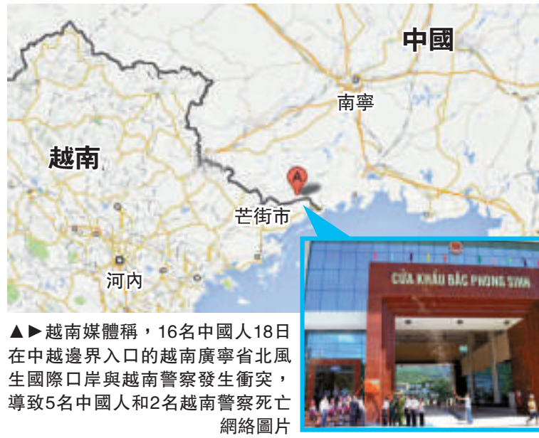
▲越南媒體稱，16名中國人18日在中越邊界入口的越南廣寧省北風生國際口岸與越南警察發生衝突，導致5名中國人和2名越南警察死亡。

【大公報訊】18日下午，在中越邊界入口的越南廣寧省北風生國際口岸發生暴力衝突，造成至少5名中國人和2名越南邊防警衛身亡。廣寧省政府已經否認事件與恐怖組織有關。中越兩國表示正對事件進行聯合調查。中國外交部就事件回應稱，注意到有關中越邊境發生暴力事件，正和相關部門核實，了解事件真相。 據英國廣播公司報導，暴力衝突發生前，一些非法進入越南境內的中國人被拘禁。他們在等待遣返回國期間，一些人從越南邊防警衛手中奪取武器，並且開槍造成傷亡。