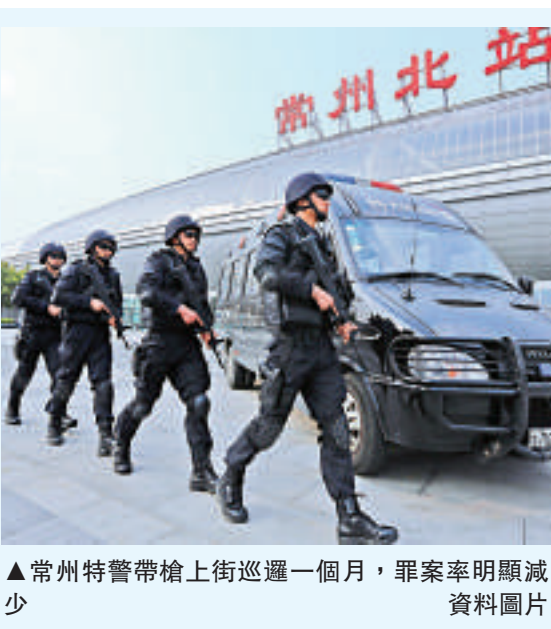
▲常州特警帶槍上街巡邏一個月，罪案率明顯減少。資料圖片