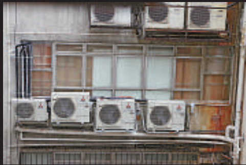
▲「六四館」向漆成圓的窗戶全被展板封死，阻礙火警時逃生