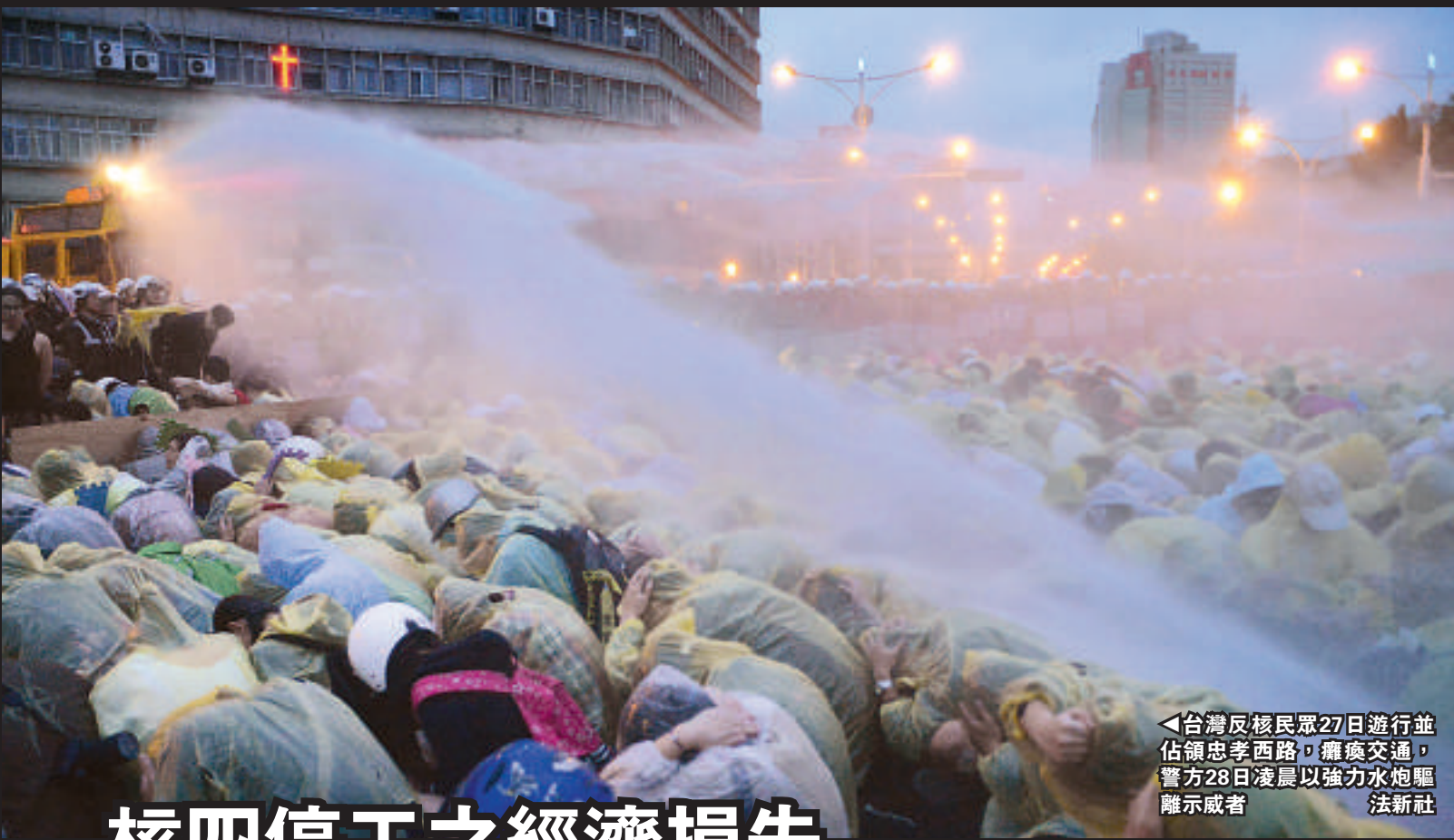
◀台灣反核民眾27日遊行並佔領忠孝西路，癱瘓交通，警方28日凌晨以強力水炮驅離示威者