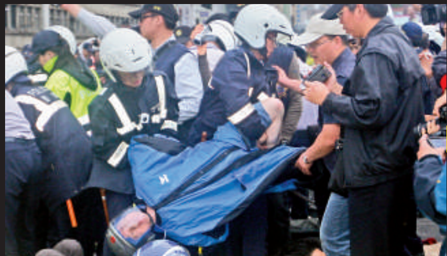
◀台北警方28日凌晨展開驅離行動，抬離非法佔路的反核民眾

另據中評社報導，台灣指標民調(TISR)最新民調顯示，26.3%贊成永遠停建、13.8%暫時停建交由公投決定、14.0%暫時停建安檢再決定；7.6%主張蓋完但不運轉、19.9%蓋完且運轉發電，有18.5%未明確表態。