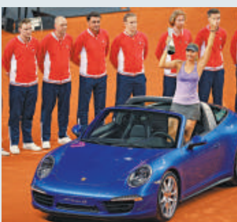
▲舒拉寶娃(前)坐在開蓬跑車上向球迷揮手致意，名副其實的香港美人

■綜合外電德國二十七日消息：6號種子、俄羅斯「美少女」舒拉寶娃周日在斯圖加特網球公開賽奪得冠軍，她於決賽以盤數2:1反勝9號種子、塞爾維亞球手艾雲洛域，除了打破1年的「冠軍荒」兼獲得個人第30冠之外，更是在項賽事完成3連霸的壯舉。首盤，艾雲洛域發揮極佳，一度領先4:0，最終以6:3先下一城。次盤，艾雲洛域以3:1領先，但舒娃急起直追，遂以6:4反勝而扳平盤數。決勝盤，氣勢極佳的舒娃以6:1輕鬆勝出，成功登頂。