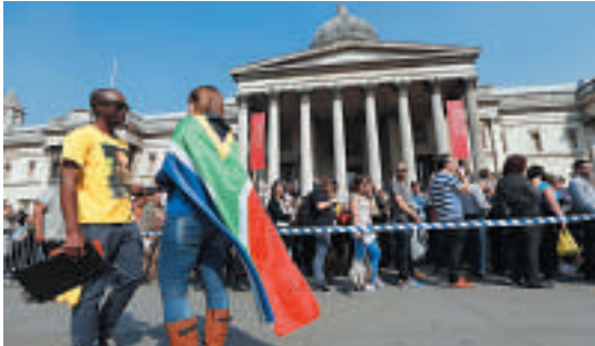
◀倫敦的南非人四月三十日在特拉法加廣場提前投票美聯社