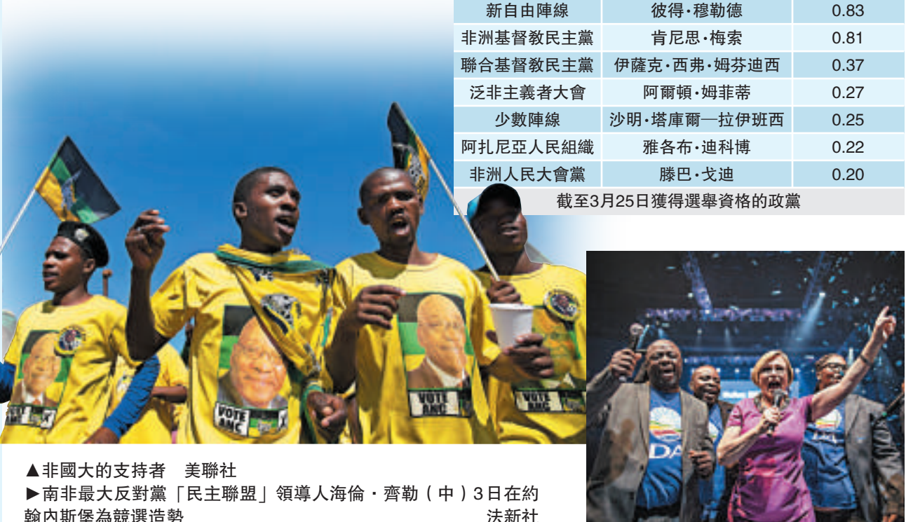
▲非國大的支持者