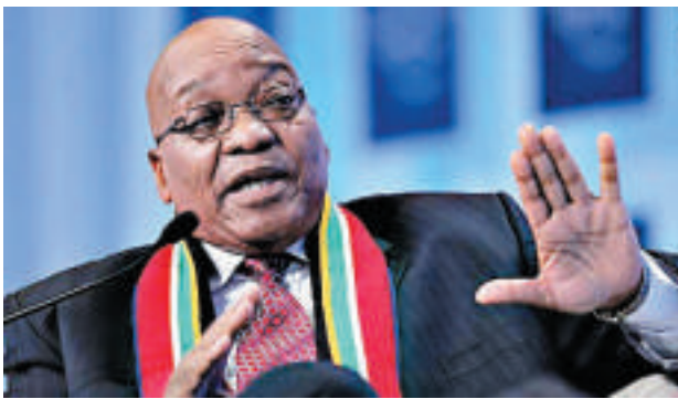
▲南非總統祖馬 資料圖片