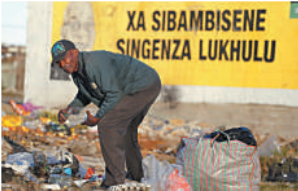
▲開普敦的一名拾荒者，他背後的牆上寫有今次大選的宣傳標語