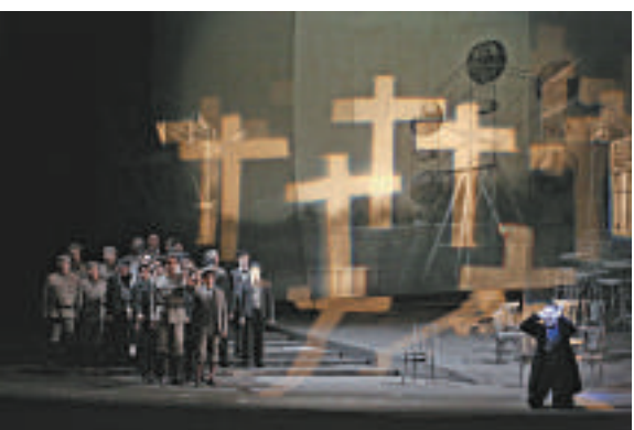
▲《浮士德》描述了邪惡力量與宗教之間的浪漫、誘惑及長久鬥爭的故事