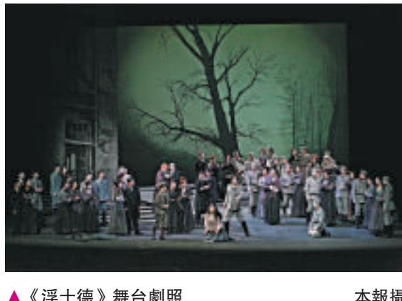
▲《浮士德》舞台劇照