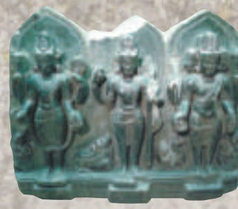
▲目真鄰陀龍王庇護釋迦牟尼佛像