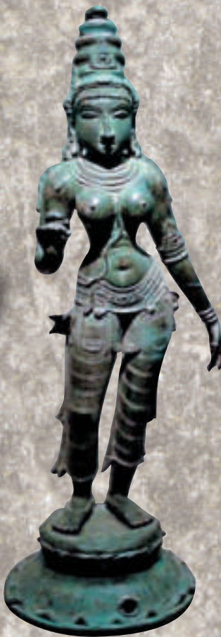
▲印度教大地女神普黛維像