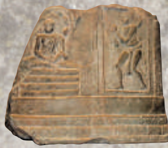
▲目真鄰陀龍王庇護釋迦牟尼佛像