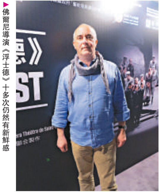
▲佛爾尼導演《浮士德》十多次仍然有新感覺