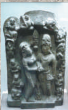
▲濕婆與難近母結婚像