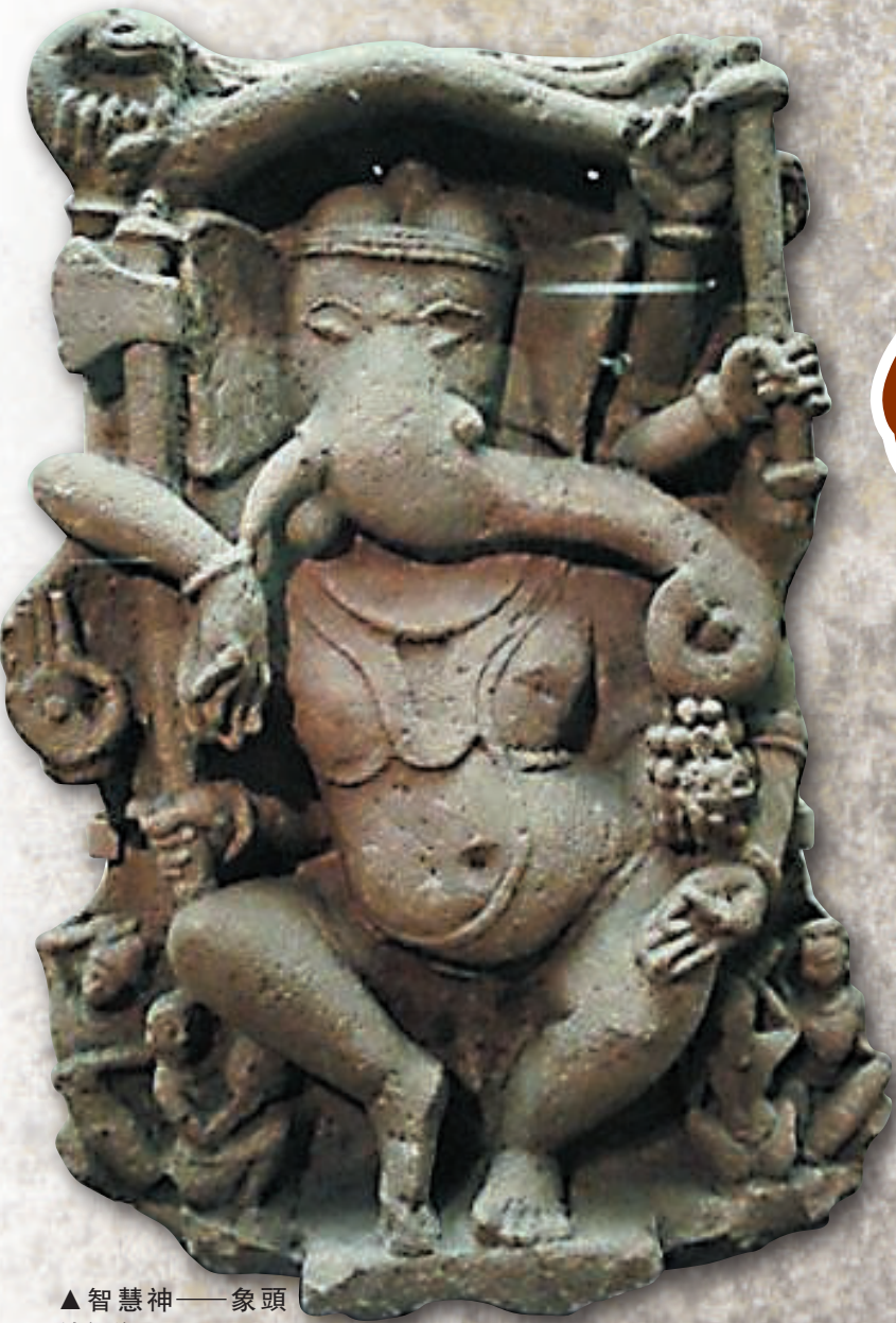
▲智慧神——象頭神舞像