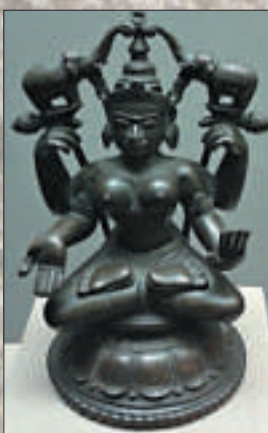
▲接受洗禮的吉祥天女像