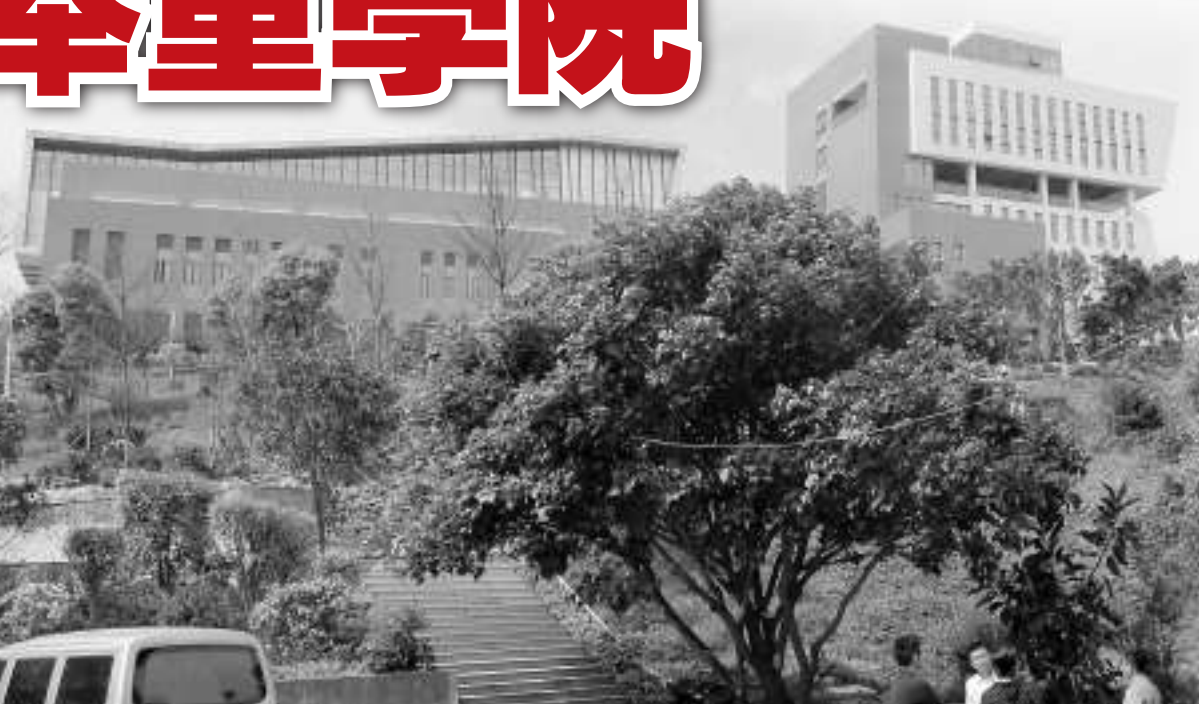
▲位於福州馬尾翔龍山頂的中國舉重基地三期，經過三年多時間的建設現已竣工，即將投入使用

三是福建擁有雄厚的教練基礎，世界級好手層出不窮。福建舉重隊總教練陳文斌長期擔任國家男子舉重隊總教練，培養了大批奧運冠軍和世界冠軍，目前為福建師範大學體