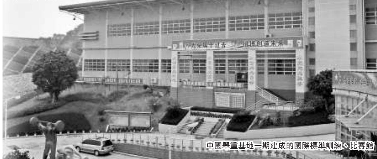
中國舉重基地一期建成的國際標準訓練、比賽館