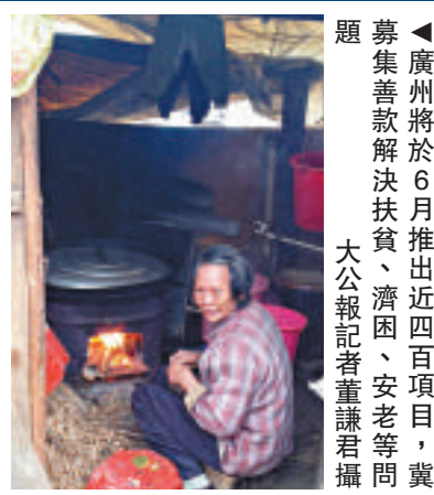
▲廣州將於6月推出近四百項目，冀集善款解決扶貧、濟困、安老等問題