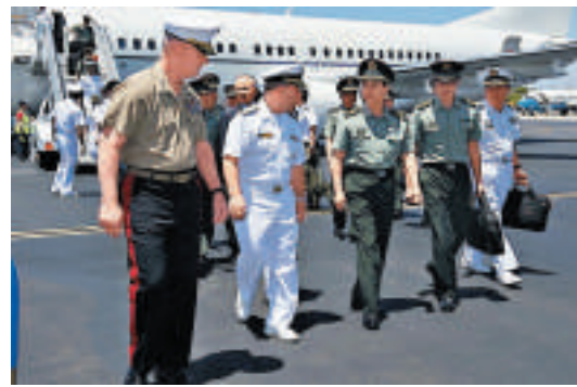
▲房峰輝（前排中）將與美國參謀長聯席會議主席登普西會面