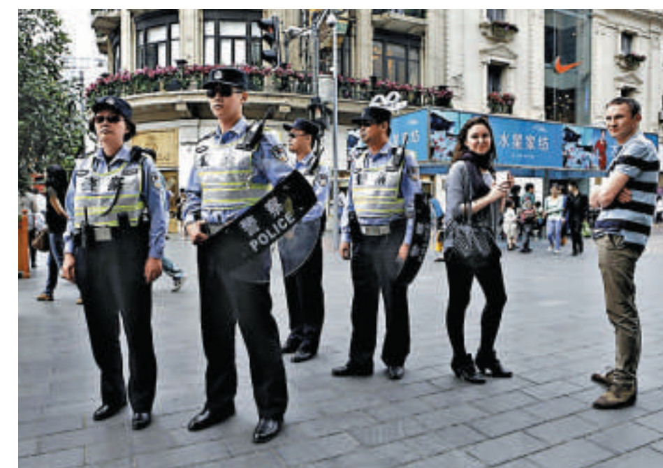
▲上海特警衝鋒隊隊員配備防暴頭盔和防彈防刺服，以及警棍、盾牌等近20款裝備上街巡邏

同時，在中心、次中心城區的117個派出所，各安排1輛GPS巡邏車，實施佩槍巡邏。武裝力量基本覆蓋中心城區，一旦發生暴力恐怖活動，確保能在最短時間趕到現場處置。