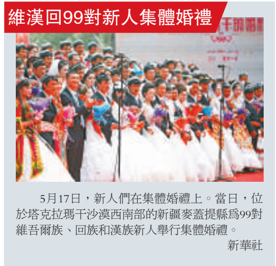
維漢回99對新人集體婚禮

5月17日，新人們在集體婚禮上。當日，位於塔克拉瑪干沙漠西南部的新疆委蓋提縣為99對維吾爾族、回族和漢族新人舉行集體婚禮。