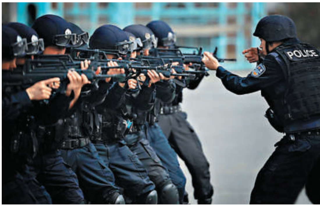
烏魯木齊警察在進行槍械訓練

吉木薩爾縣扼居南北疆與東疆交匯地帶，地處新疆最具發展活力和潛力的天山北坡經濟帶，東同奇台