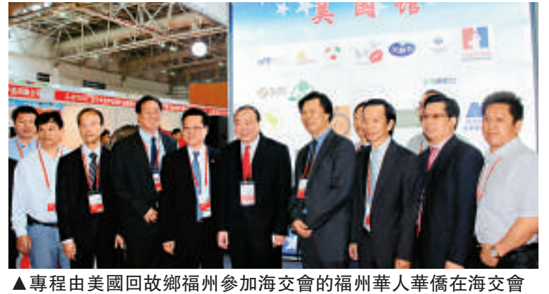
▲專程由美國回故鄉福州參加海交會的福州華人華僑在海交會「美國館」前合影

三是在辦展模式上突出專業化、市場化運作。今年第十六屆海交會將進一步推進專業化、市場化辦展。除21世紀海上絲綢之路展示館外，其餘機電展區、