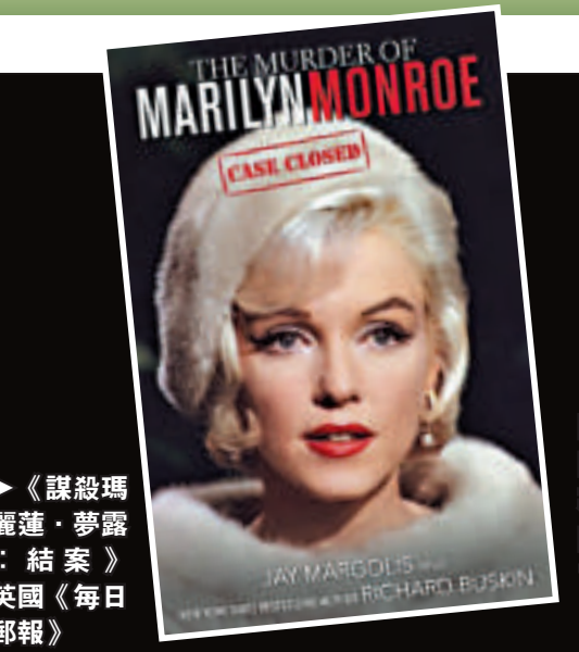
▲《謀殺瑪麗蓮·夢露：結案》英國《每日郵報》