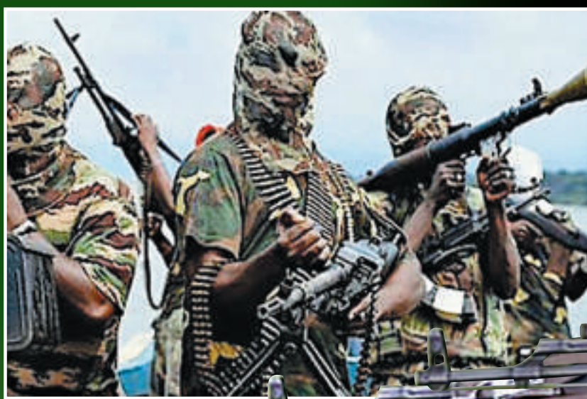
▲尼日利亞穆林極端組織「博科聖地」