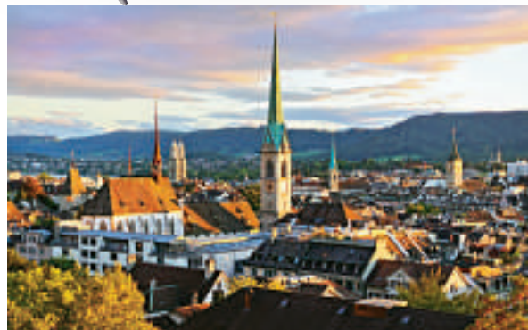
▲瑞士蘇黎世是全球物價最高的城市之一