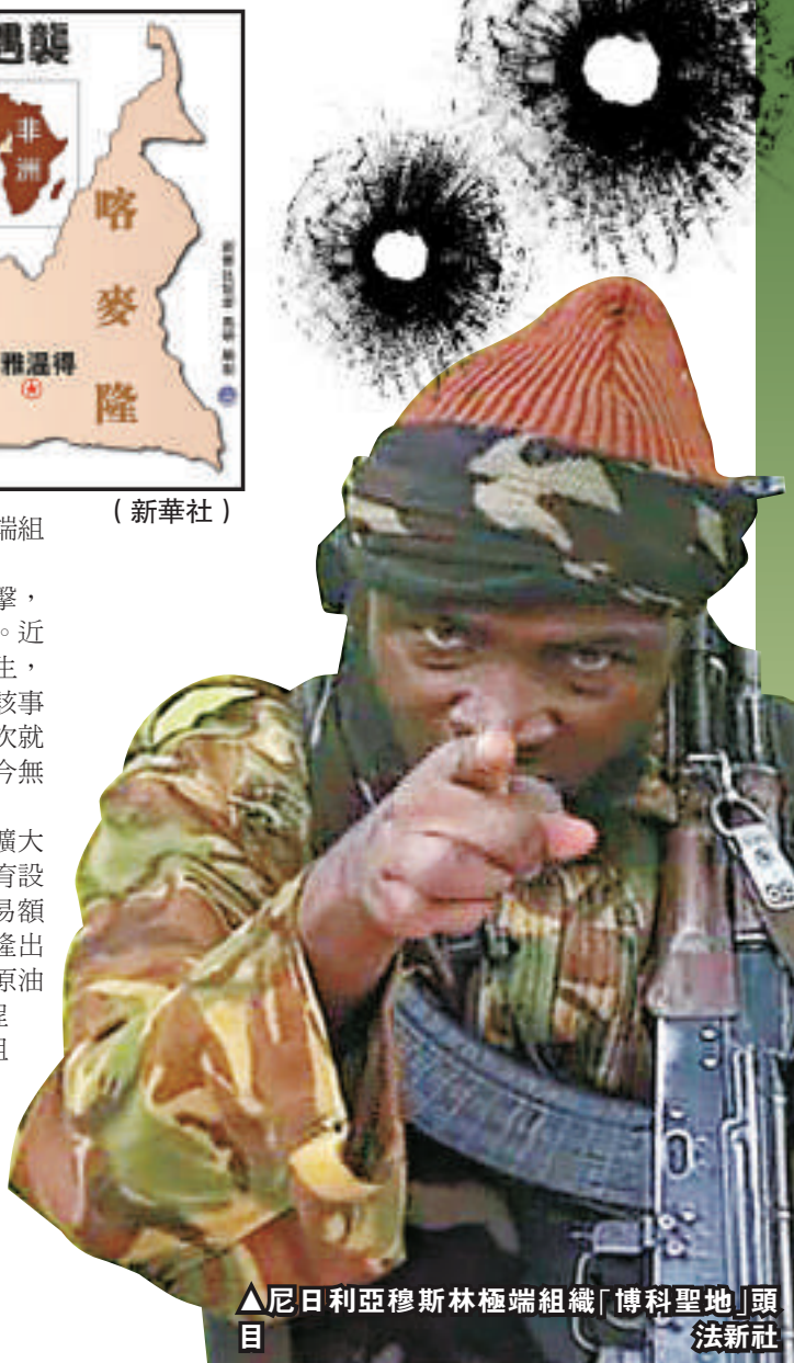
▲尼日利亞穆林極端組織「博科聖地」頭目