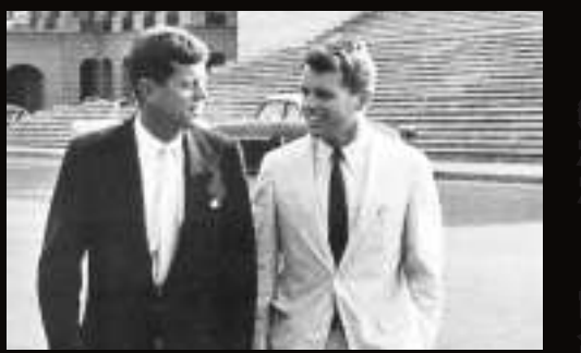
▲肯尼迪兄弟 互聯網