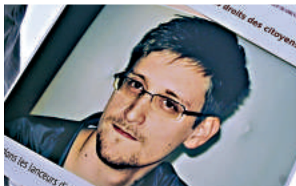
▲愛德華·斯諾登 互聯網

公投由當地最大貿易公會SGB發起，希望透過實施最低工資，保障大部分工人權益。建議受到商界及部分市民反對，政府亦警告SGB提議的最低工資，或對國家競爭力構成威脅。有經濟學家分析，隨著勞工成本上升，失業率亦隨之上升。由於當地人擔心對經濟造成的影響，估計建議不會獲得通過。