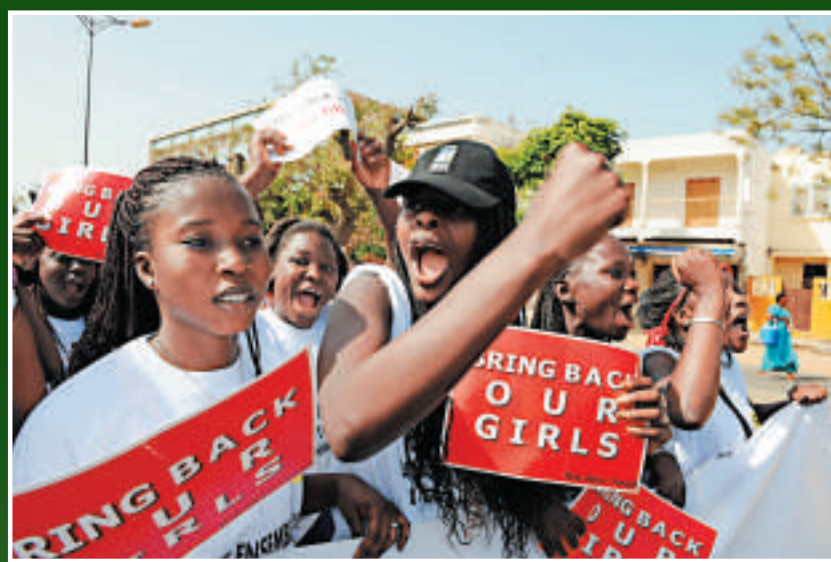
▲尼國就「博科聖地」綁架200女學生一事發起抗議遊行