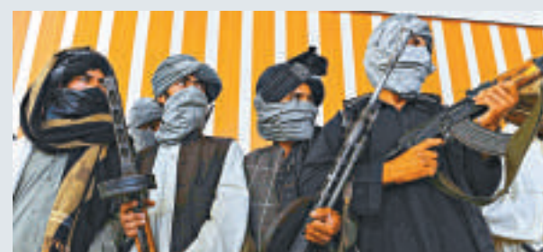
▲塔利班成員 資料圖片

當地警方表示已經開始對失蹤男子的搜尋工作。據悉，巴基斯坦綁架事件在增加，但針對中國人的情況比較罕見。1月，槍手在巴基斯坦西部偏遠地區槍殺了一名西班牙環球騎行者的6名保鏢；該騎行者的家人稱，他成功逃脫，並未受傷。