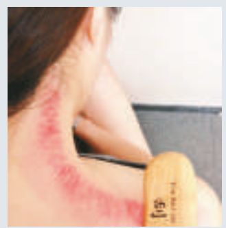
▲刮痧是中國民間傳統療法，通常會在患者身上留下瘀傷 資料圖片