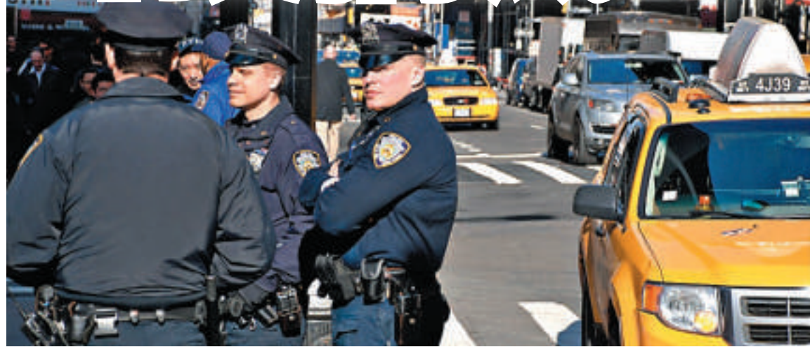
▲紐約警察街頭巡視

此外，由於智能手機的盛行，紐約警察局於今年4月推出了專屬手機應用程式。該應用會與紐約民眾分享警方消息，警方嫌疑人的照片，追捕賞金信息等等，並允許市民在線提供匿名信息。當局更為旗下警員購入谷歌眼鏡，協助他們破案。