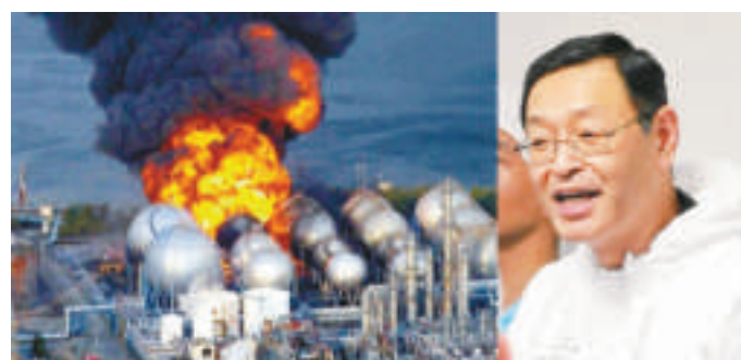
▲日本第一核電站及其前所 長吉田昌郎