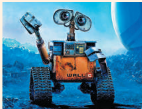
▲科幻電影《太空奇兵·威E》中的機械人主角威E