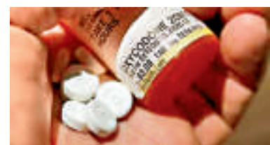
▲俗稱「土海洛因」的止痛藥奧施康定