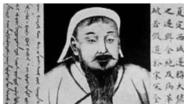
▲有關成吉思汗等中國歷史成為英國高考內容

歷史是英國第5受歡迎的A-level課程，這個改革舉動是為了給歷史教程賦予更多深度。