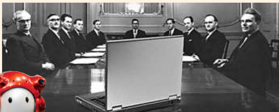
▲人工智能進入商業公司董事會為全球首例 ◀日本日立公司新機器人「EMIEW2」

據悉，「Vital」至今已協助Pathway Pharmaceuticals和InSilico Medicine兩間生命科學公司，作出重大的投資決策。公司希望「Vital」稍後獲得投票權，在涉及金錢的議題上發表意見。