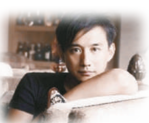
▲內地演員黃磊能演能唱 ▶周迅專輯《夏天》封面

無良媒體以博眼球爲目的，對她各種批評抹黑，而我們真正應該佩服這種華麗的重生卻如此不討好主流的人。 縱觀演藝圈，演員轉型歌手的不在少數，然而真正能夠得到大眾認可的卻只是少數。內地影星周迅算是一個。周迅初試啼聲是在一九九九年的音樂特輯《海南 海南》中演唱插曲《飄搖》，雖然她的嗓音同樣較低且沙啞，但給人的感覺卻是溫暖的，而這首《飄搖》則透過聲音表達出了一絲無處落地的悲涼。在二〇〇二年和二〇〇五年，周迅分別發行的兩張專輯《夏天》和《偶遇》，都得到了業界和大众的肯定，那首《偶遇》更是記錄了當年一段美麗的爱情。之後，周迅不時演唱一些電影中的歌曲，最令入動容的一次演唱應該要算那首《這世界唯一的你》，那是二〇一一年「孤獨症關懷周」的主題曲。那是二〇一一年「孤獨症關懷周」的主題曲。那是二〇一一年「孤獨症關懷周」的主題曲。