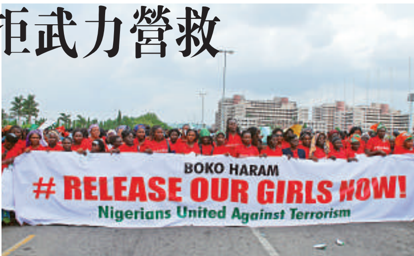
▲尼日利亞反恐團體26日在首都阿布賈示威，要求政府營救被綁架女生

另據報道，「博科聖地」曾要求尼政府釋放該組織囚犯以交換這些女學生，協議幾近達成，但最後關頭被取消。尼官員表示，政府不能同罪犯談判，也不會將罪犯與人質進行交換。 4月14日，一夥武裝人員襲擊尼日利亞東北部博爾諾州一所女子中學，擄走200多名女學生。部分女學生設法逃走，但仍有大約200人失蹤。「博科聖地」事後宣布這起襲擊事件是其所為，並威脅將這些女學生「在市場上賣掉」，引發國際社會擔憂。許多國家和國際組織已參與解救這些女學生的行動。