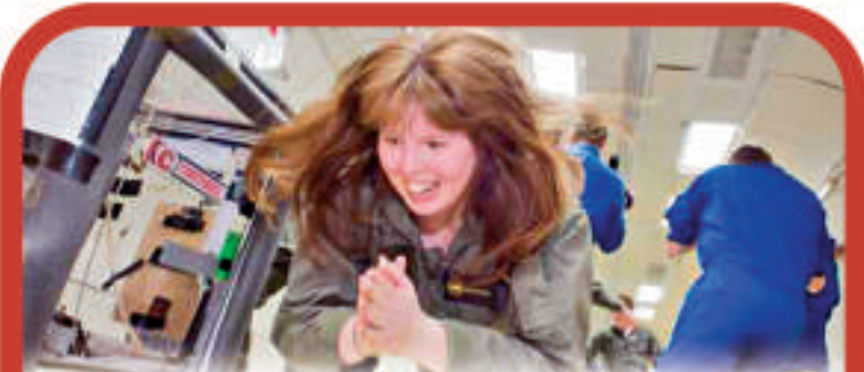
▲乘客將體驗15次、每次約25秒的失重狀態